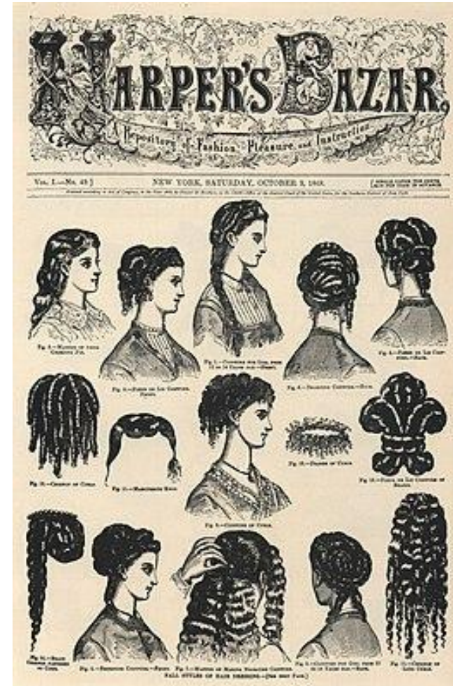
Обложка журнала Harper's Bazaar