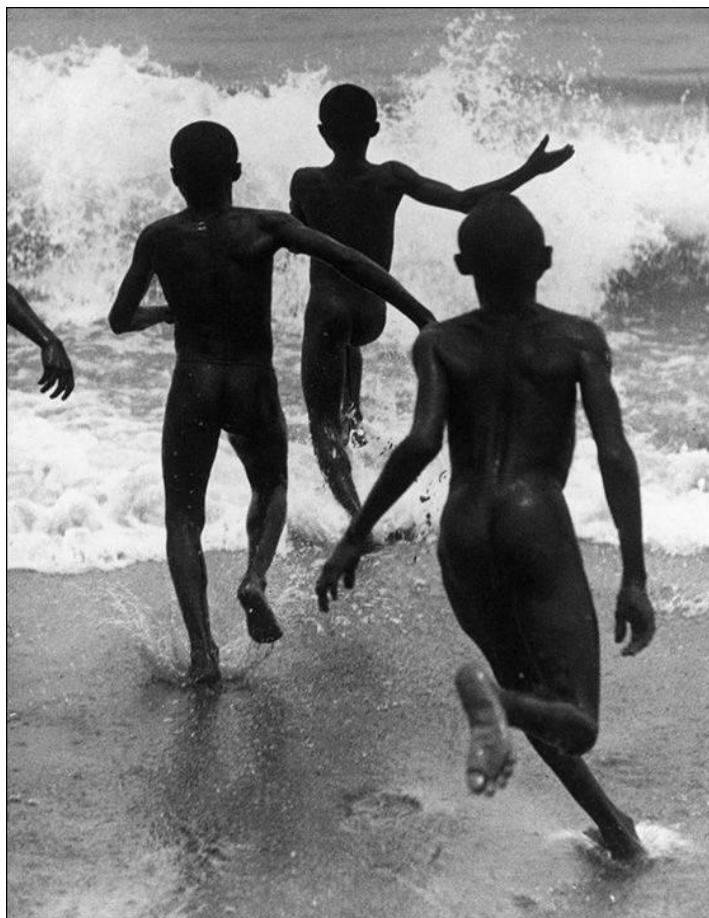
"Три мальчика на озере Танганьика"