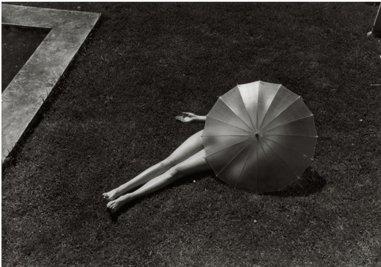
Первый снимок Мартина Мункачи, опубликованный в Harper's Bazaar