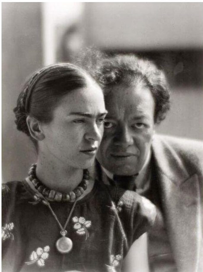
Фрида Кало и Луи Армстронг в объективе Мартина Мункачи