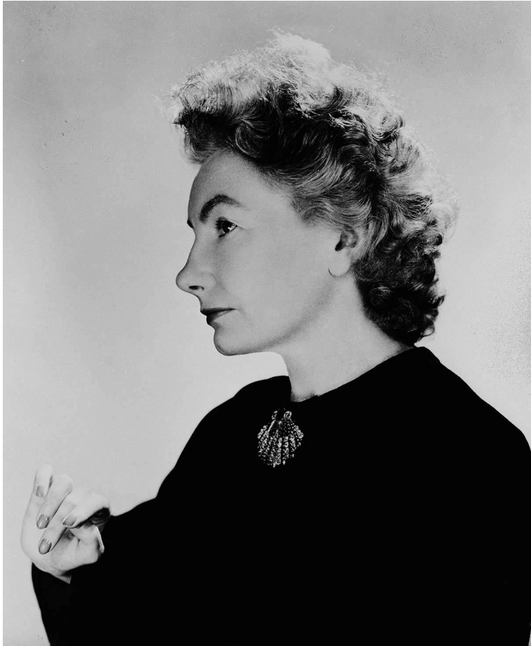
Кармель Сноу - главный редактор журнала Harper's Bazaar