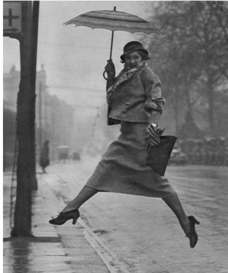
The Puddle Jumper