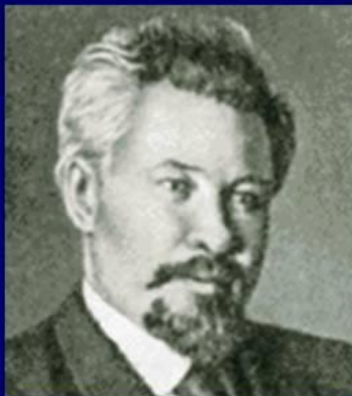
Виктор Михайлович Чернов , председатель