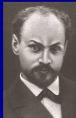
Григорий Андреевич Гершуни