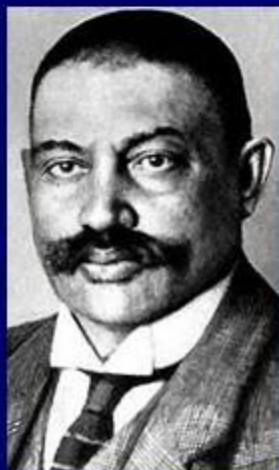
Евно Фишелеви ч Азеф