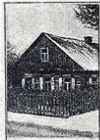
ДОМ В КОТОРОМ ЗАСЕДАЛ СЪЕЗД