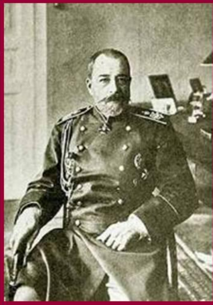
П.Д.Святополк-Мирский -либерально настроенный князь, назначен министром внутренних дел в 1904г.

В к. 1904 г.в записке царю он предложил план государственного переустройства –