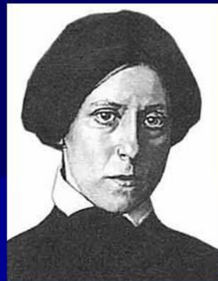
Мария Александровна Спиридонова