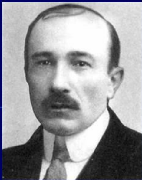
Борис Викторович Савинков