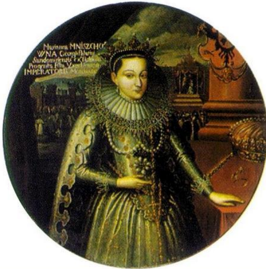
Марина Мнишек. Миниатюра н. 17 в.

Его опознала Мария Нагая, а В. Шуйский заявил, что выводы по угличскому делу он сделал под давлением Годунова. Новый царь раздал должности полякам но остальные обещания не выполнил. В 1606 г. он объявил себя императором. В мае состоялась его свадьба с Мариной Мнишек. Поведение царя породило слухи, что он — «ненастоящий».