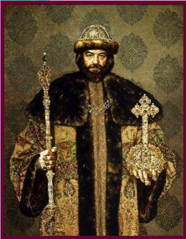
С.Присекин. Борис Годунов

Новым царем был избран Борис Годунов. Но он отказался занять престол. Только в сентябре 1598 г. разбив крымских та-тар Борис короновался.