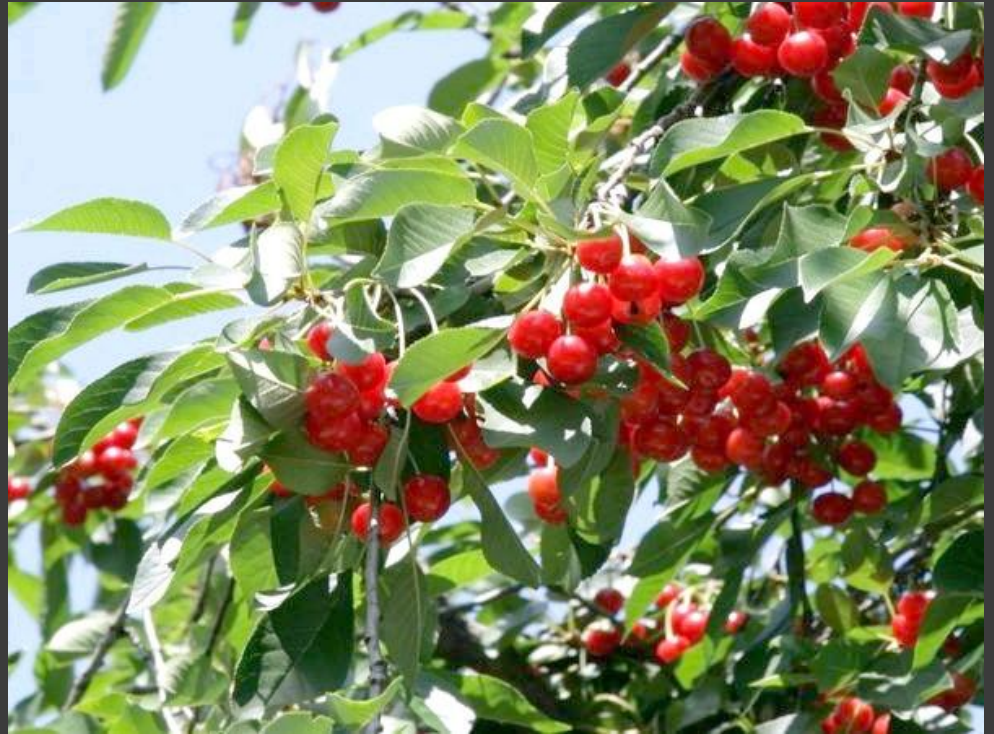
Вишня звичайна ( Prunus cerasus ) Ареал: Євразія, півн. Америка