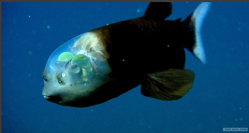
Малорота макропіна ( Macropinna microstoma )

Ареал: в субарктичних та помірних водах північної частини Тихого океану: біля берегів Північно-східної Японії , Курильських островів , в Беринговому морі , біля західного узбережжя Канади та США , на південь до Каліфорнійської затоки ( Мексика )