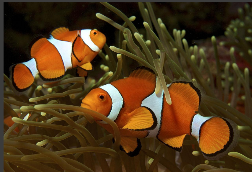
Анемонова риба ( Amphiprion ocellaris )

Ареал: в субарктичних та помірних водах північної частини Тихого океану: біля берегів Північно-східної Японії , Курильських островів , в Беринговому морі , біля західного узбережжя Канади та США , на південь до Каліфорнійської затоки ( Мексика )