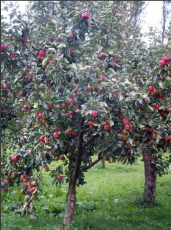
Яблуня домашня ( Malus domestica ) Ареал: Євразія, півн. Америка