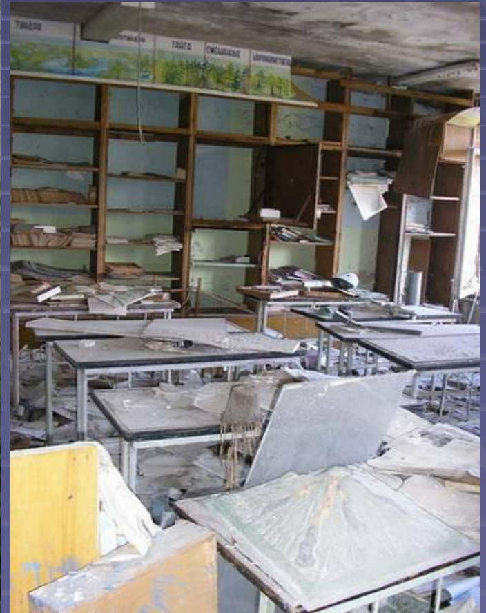
■ кабинет географии