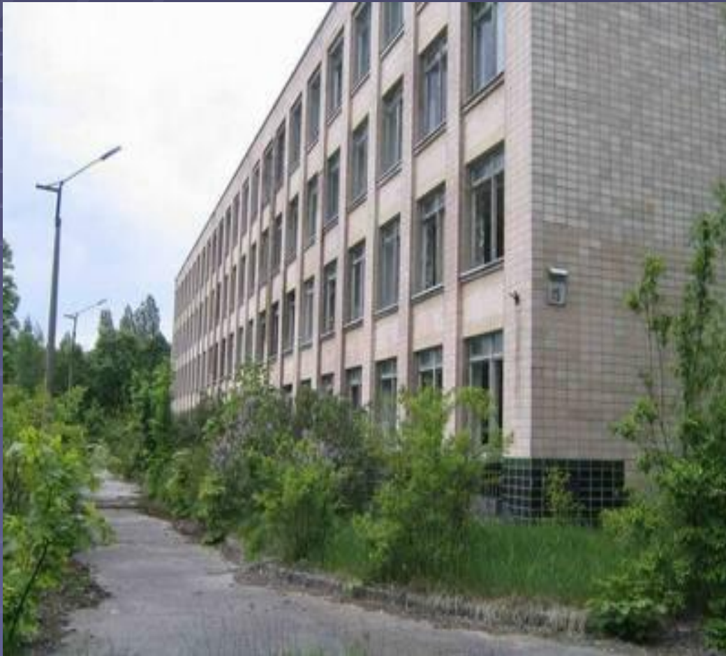
■ школа №1