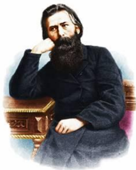
Иван Захарович Суриков 1841 – 1880