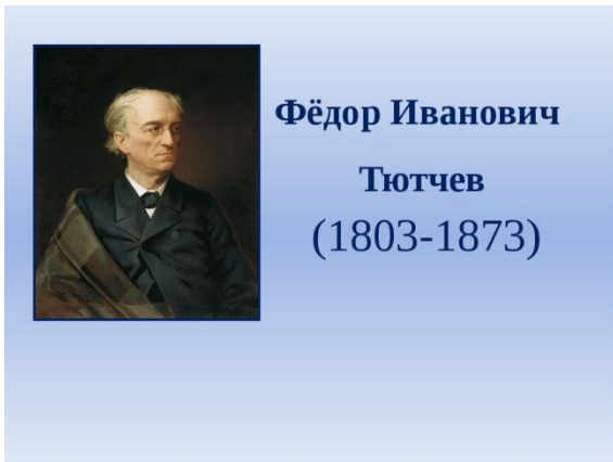
Фёдор Иванович Тютчев (1803-1873)