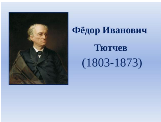
Фёдор Иванович Тютчев (1803-1873)