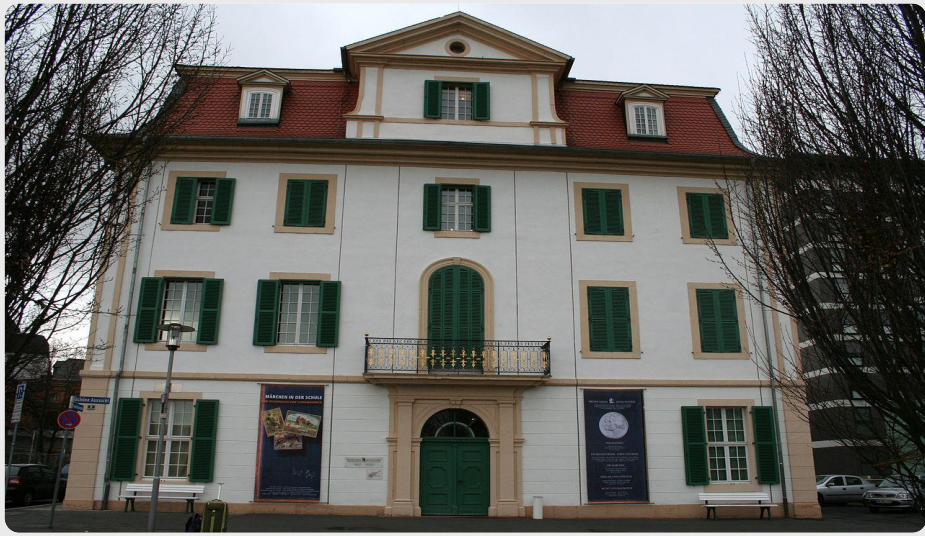
Brüder Grimm-Museum Kassel