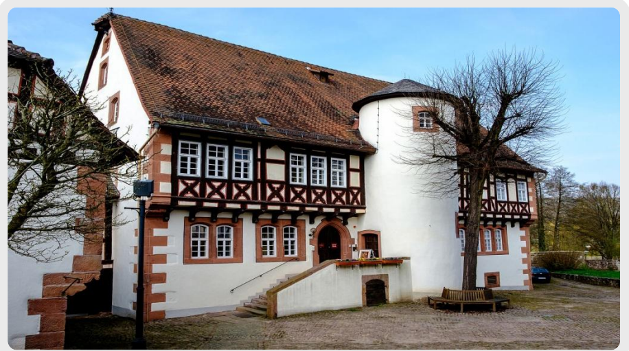
Brüder Grimm-Museum Steinau