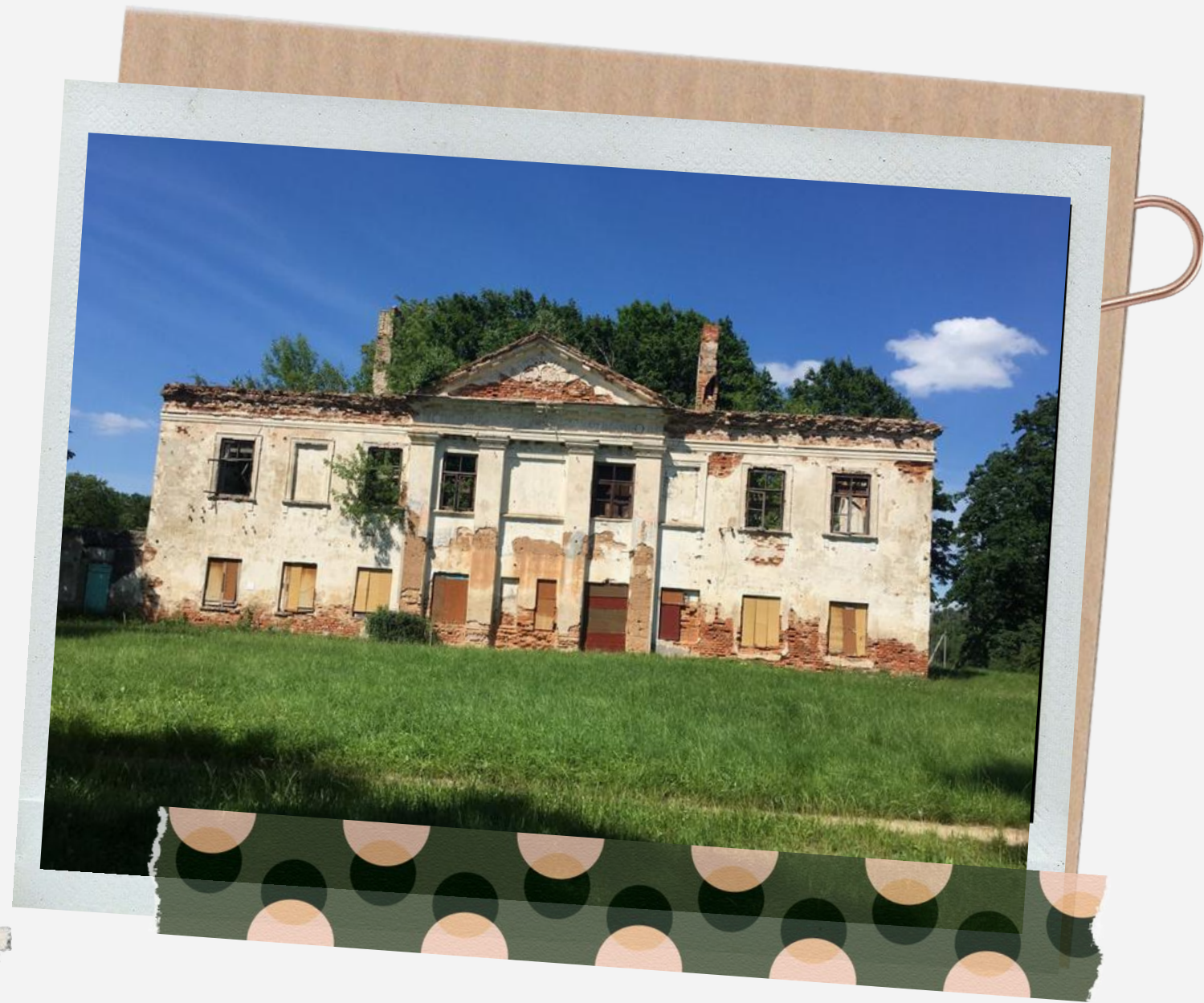
УСАДЬБА СОЛТАНОВ В МУРОВАНЕ