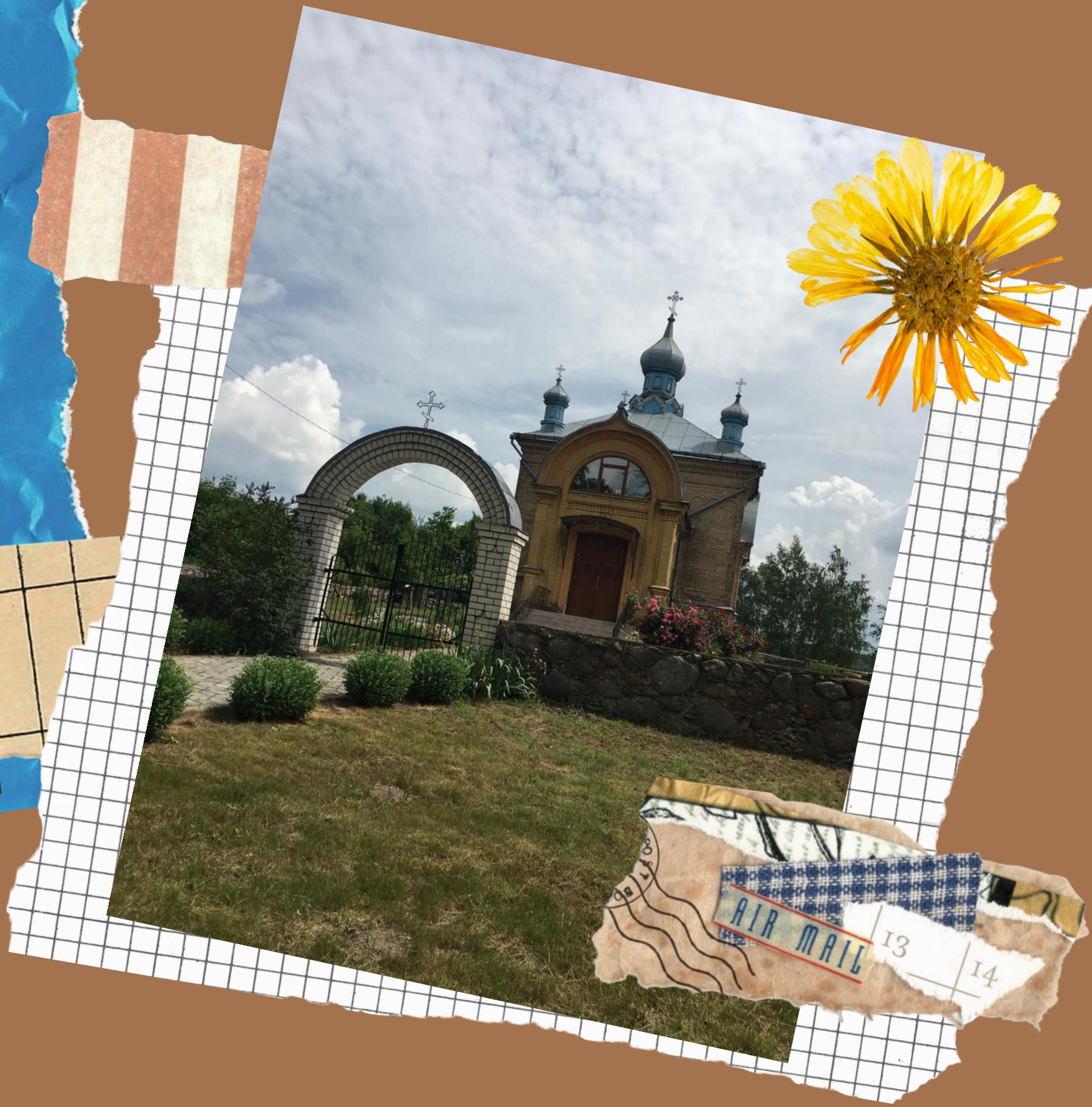
Храм Успения Пресвятой Богородицы