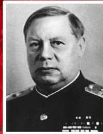
Федор Иванович Толбухин (1894-1949)