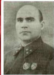
Кузьма Акимович Гуров (1901-1943)

В сентябре 1943-го Гуров в составе войск Южного фронта (членом Военного совета которого он являлся) принял активное участие в освобождении Донбасса от фашистов.