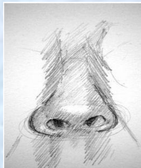
Finishing the nose Click back in your browser to return.

его всюду суют, вмешиваясь не в свое дело.