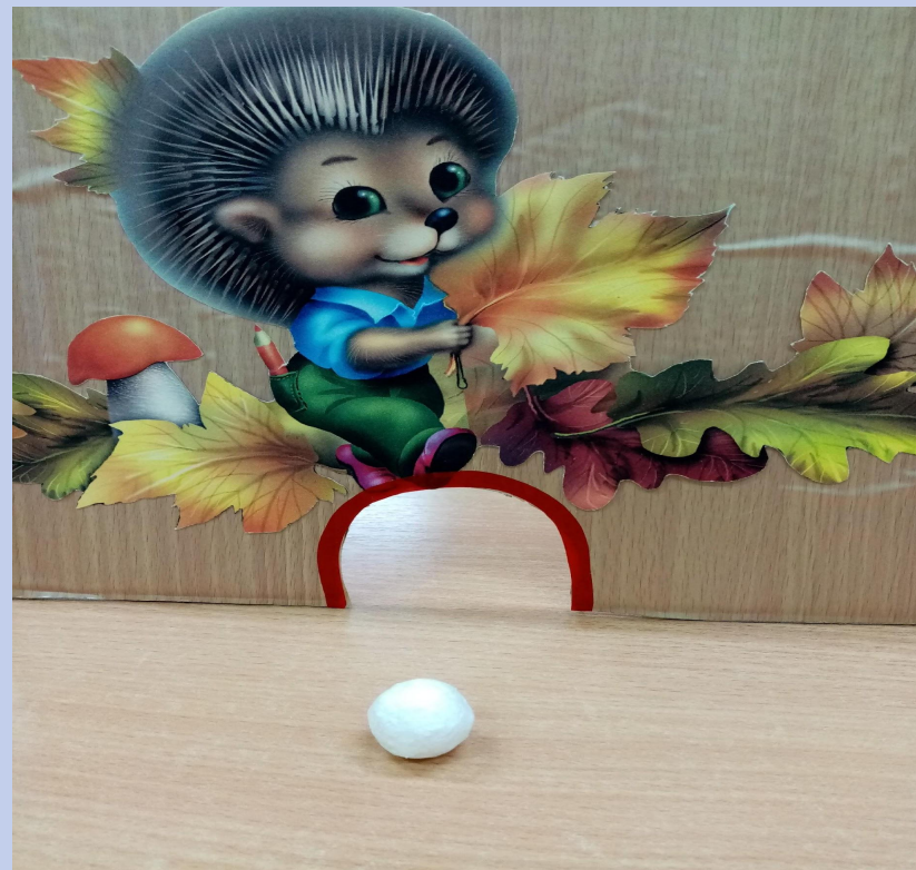
"Мяч в ворота"