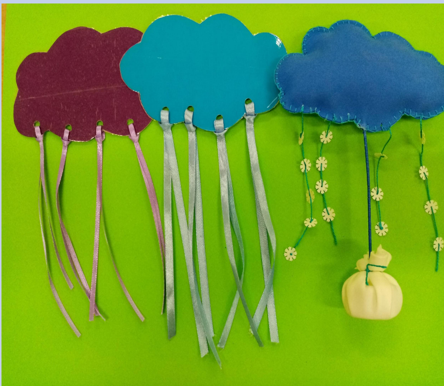
"Облако с дождиком"