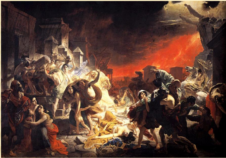
Последний день Помпеи