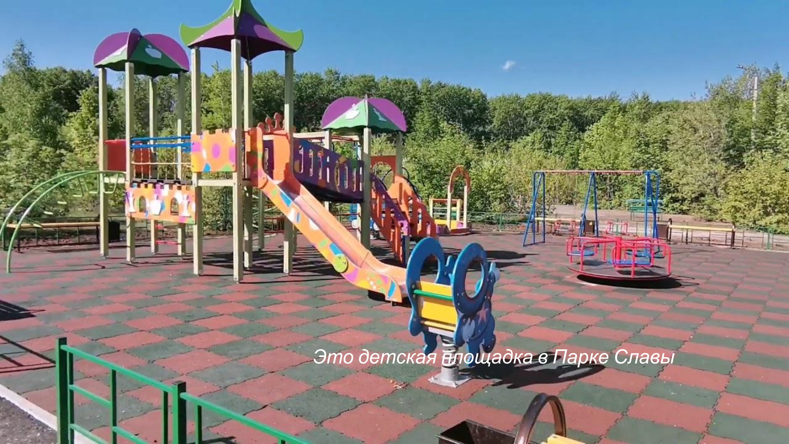
Это детская площадка в Парке Славы