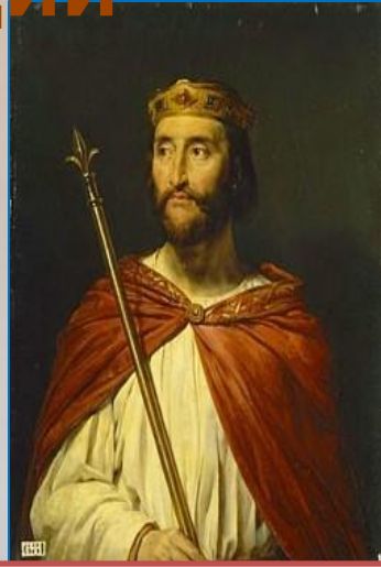
Карл Простоват ый