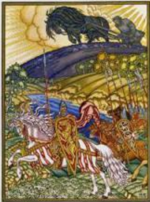
И.Билибин «Вольга и Микула»