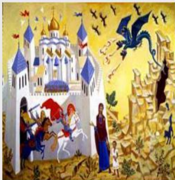
Г. Травников «Былина»