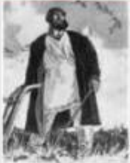
Е.Кибрик «Микула Селянинович»