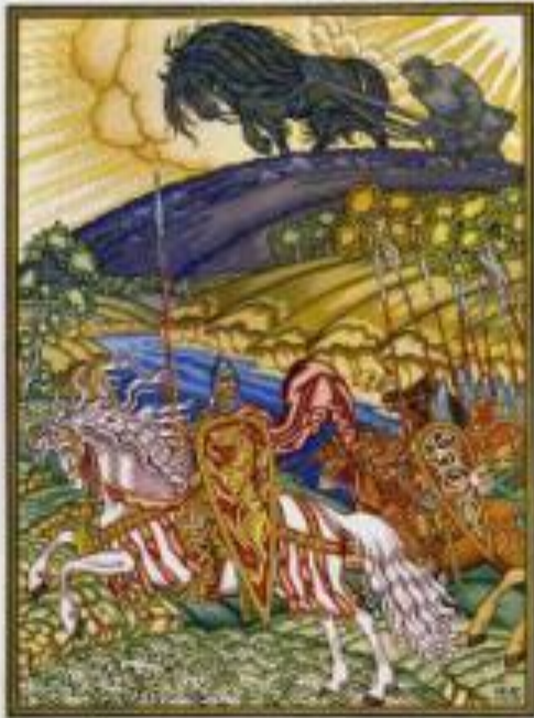
И.Билибин «Вольга и Микула»

По-старинному – оратай . Мать-сыра-Земля его любит и помогает ему, поэтому крестьянин Микула может посрамить и Святогора, и Вольгу. Микула олицетворяет силы народные: сегодня он мирно трудится на пашне, а завтра, если придут враги на Русскую землю, возьмётся за меч.