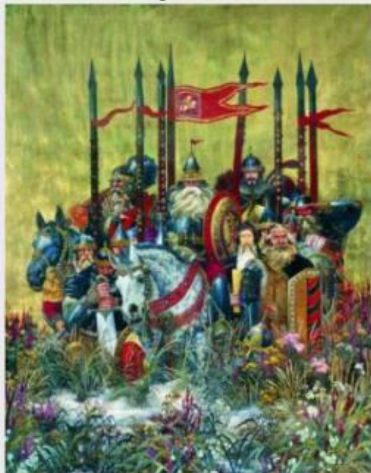
Ю. Арсенюк «Богатырская застава»

необыкновенной физической силы и воинской доблести, носитель нравственных ценностей своего народа. Смысл жизни богатырь видит в служении родине.