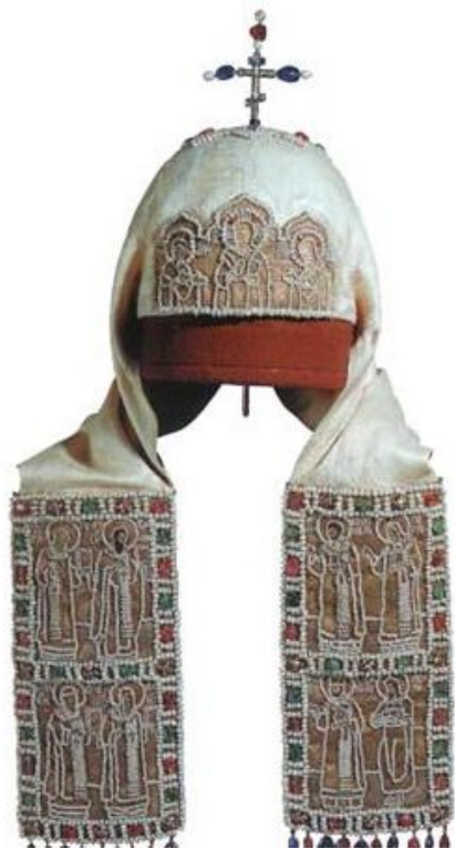
Белый кlobук патриарха Никона