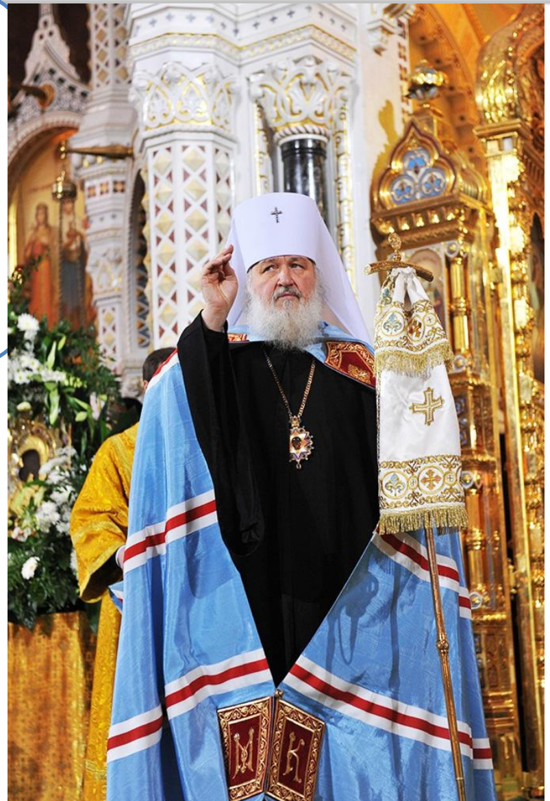
Мантия Патриарха Всея Руси Кирилла