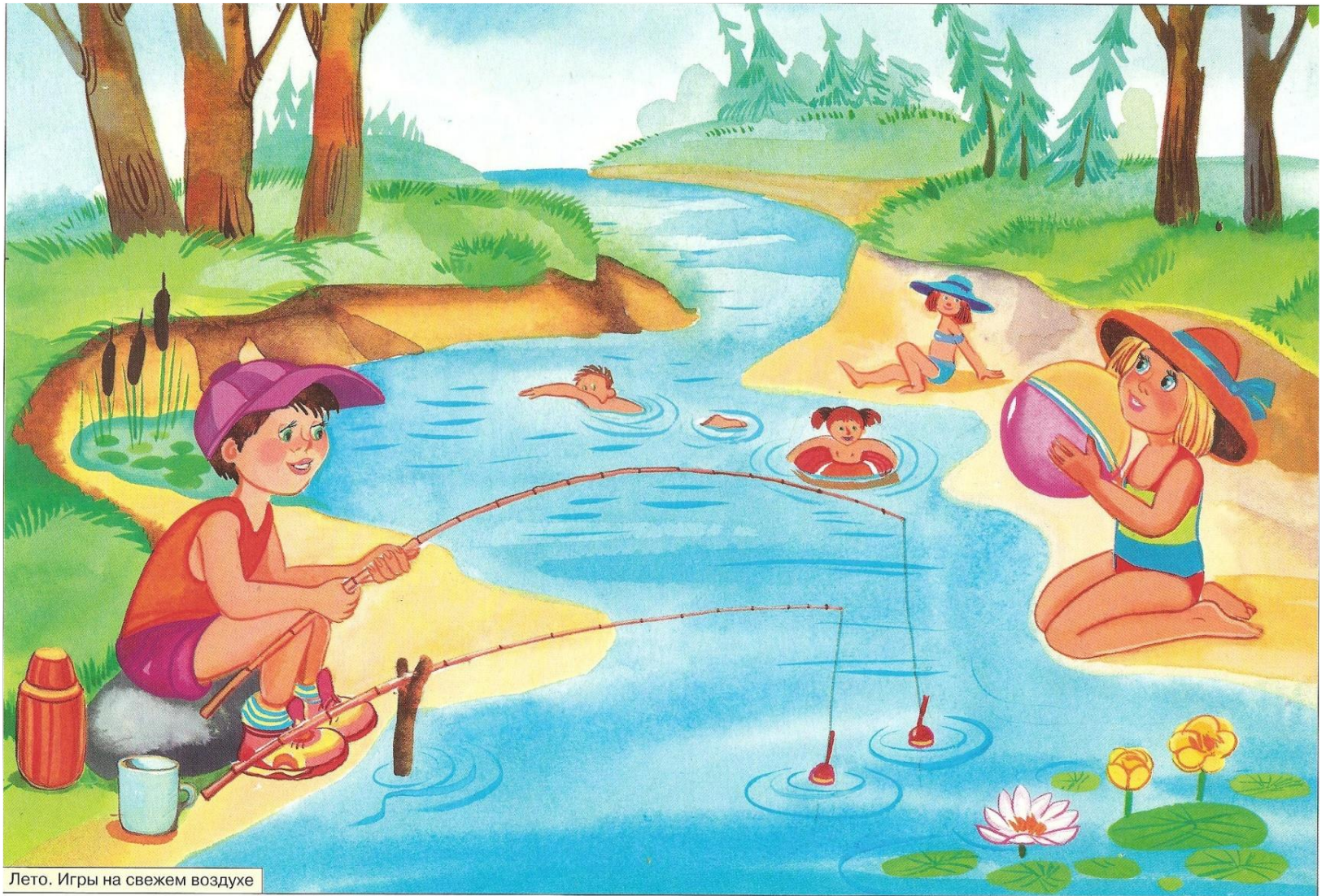
Лето. Игры на свежем воздухе