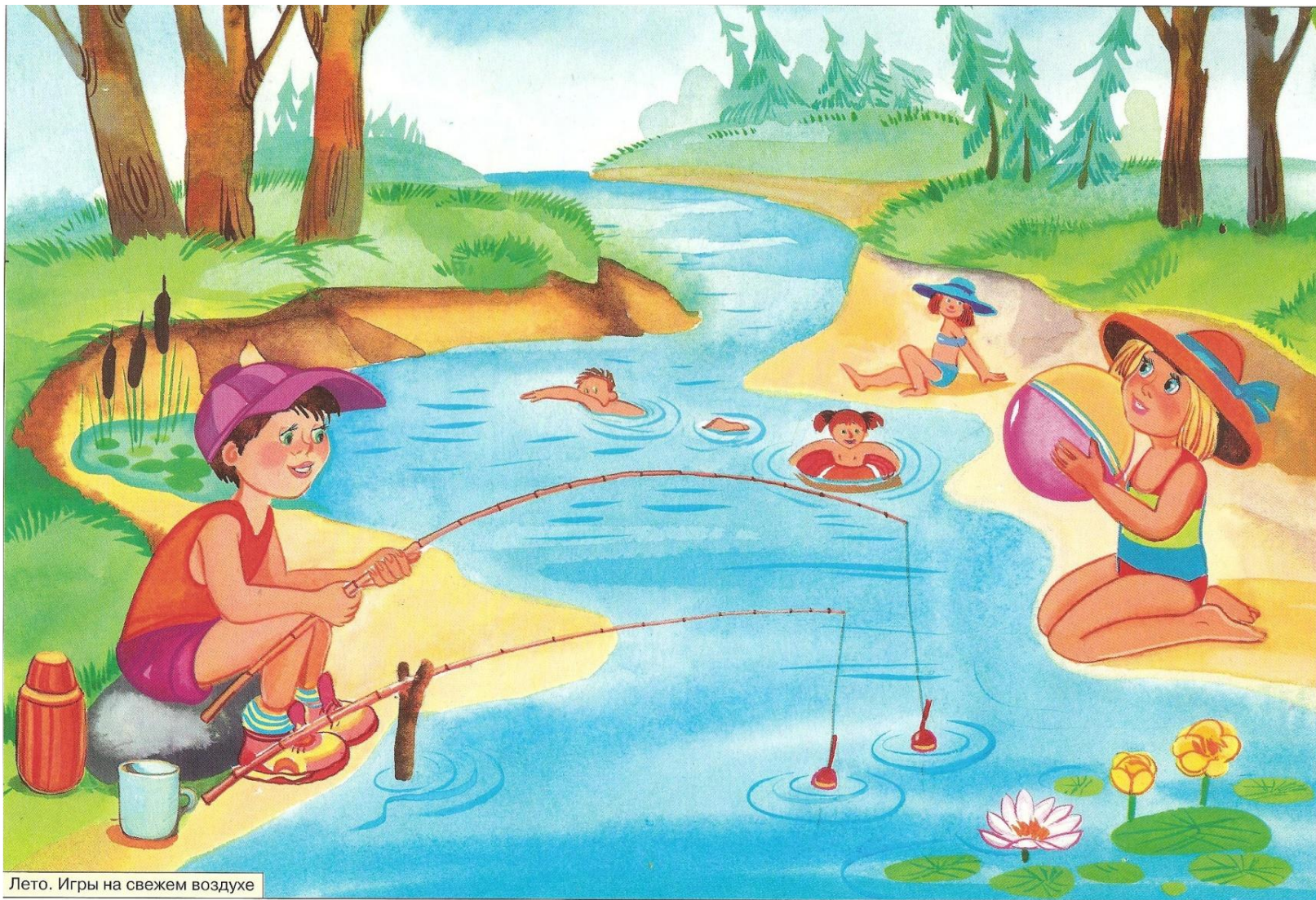
Лето. Игры на свежем воздухе