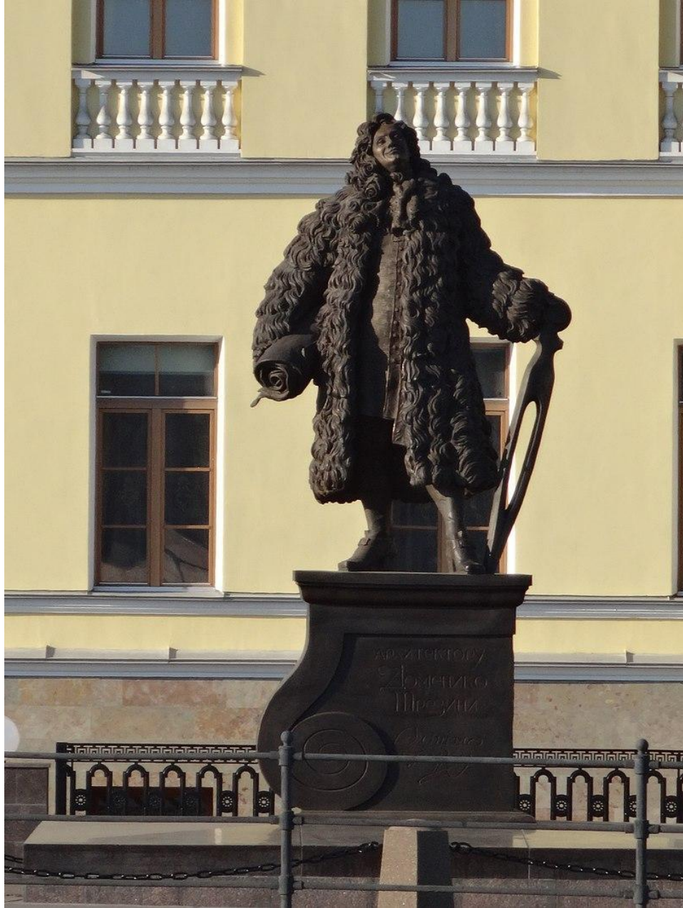
Памятник Трезини у дома Трезини