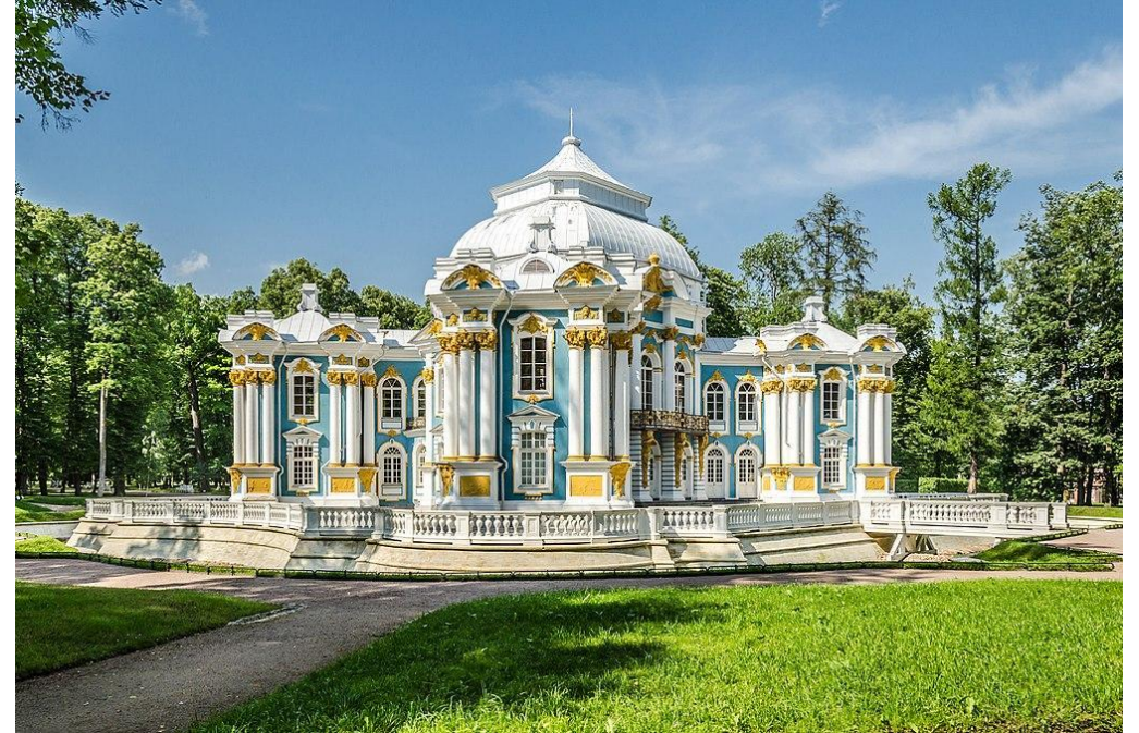
Эрмитаж (Царское село)