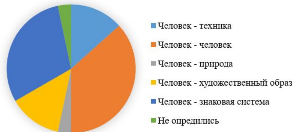
Рисунок 2. Распределение выбранных учащимися профессий по классификации Е.А. Климова