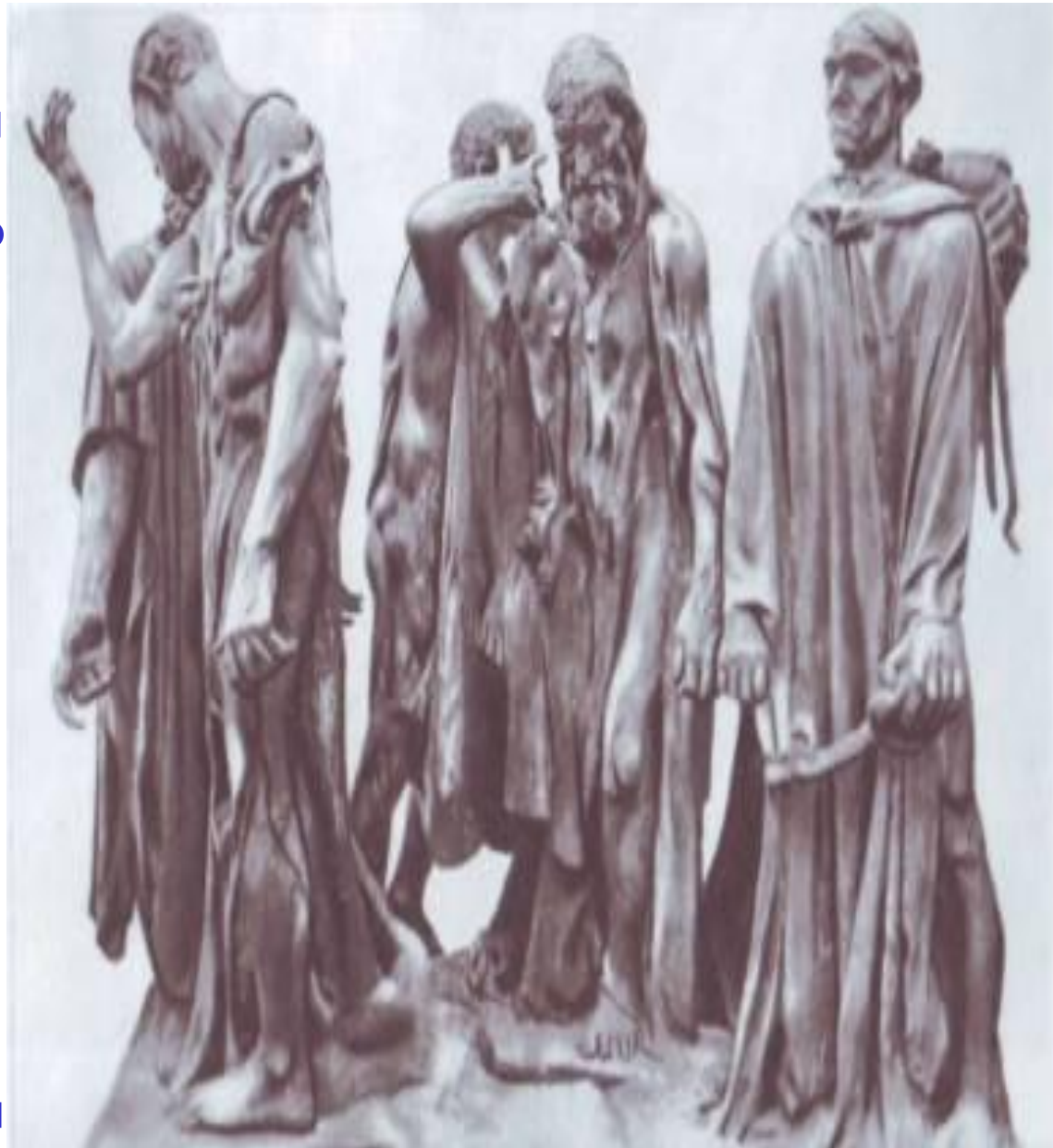
РОДЕН «Граждане Кале». Бронза

Это памятник героическому самопожертвованию для спасения сограждан.