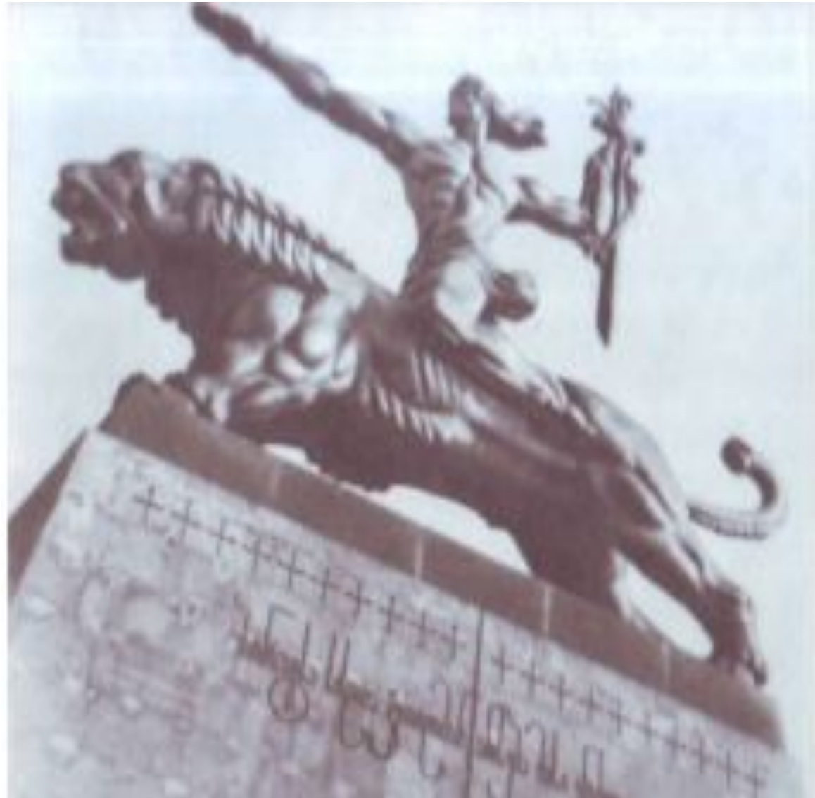
Э.АМАШУКЕЛИ «Юноша верхом на льве»