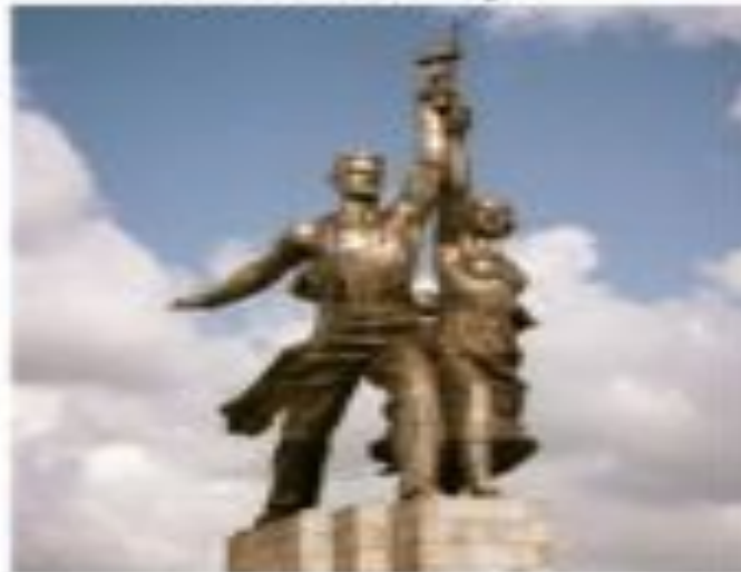
• Родина мать