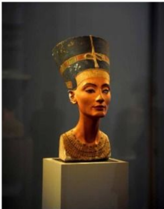
Бюст египетской царицы Нефертити