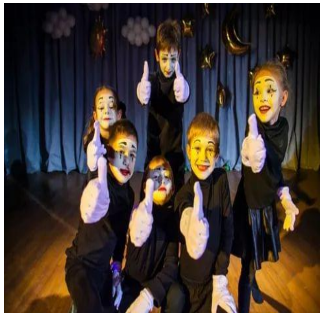
Занятие по актерскому мастерству