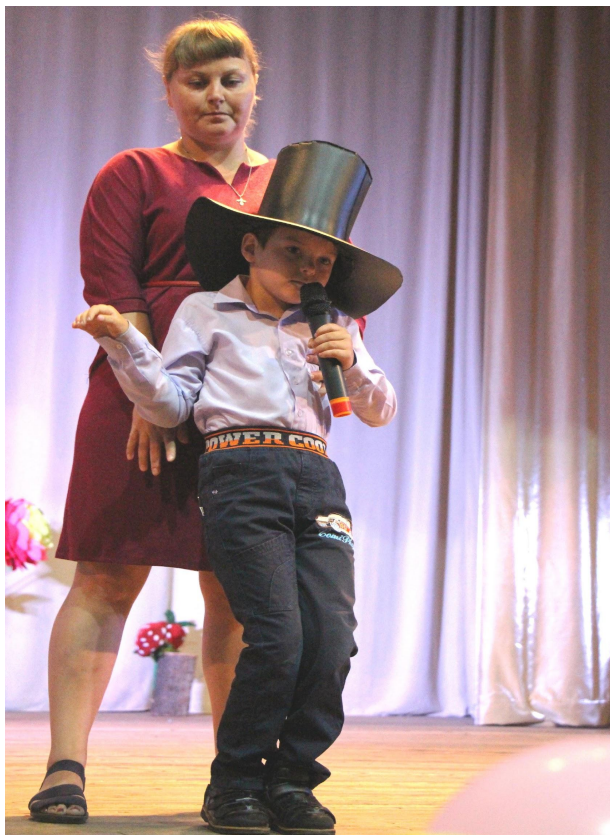
Открытие театр – студии «Мозаика»