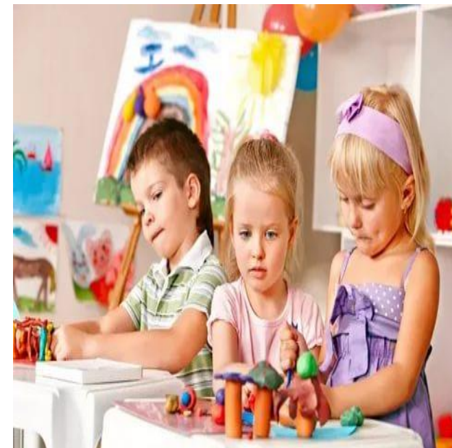
Творческие занятия на развитие