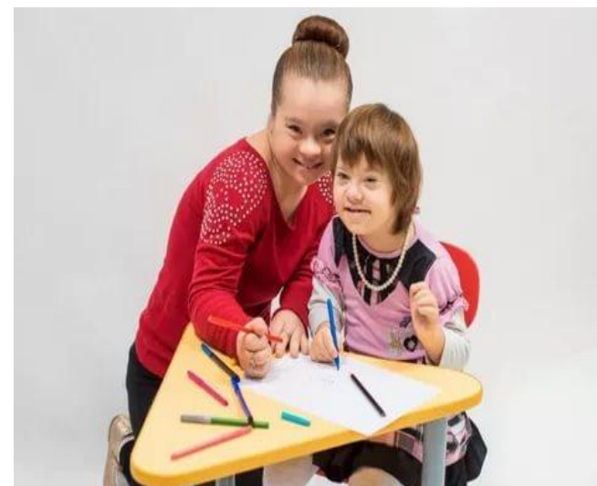
Дети с ОВЗ