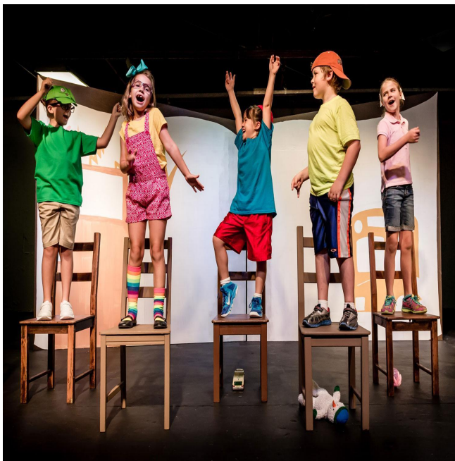
Занятие по словесному действию