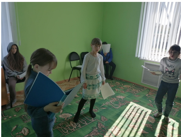
Изучение и обсуждение сценария