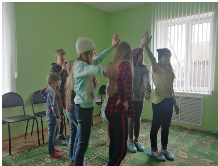
Изучение и обсуждение сценария