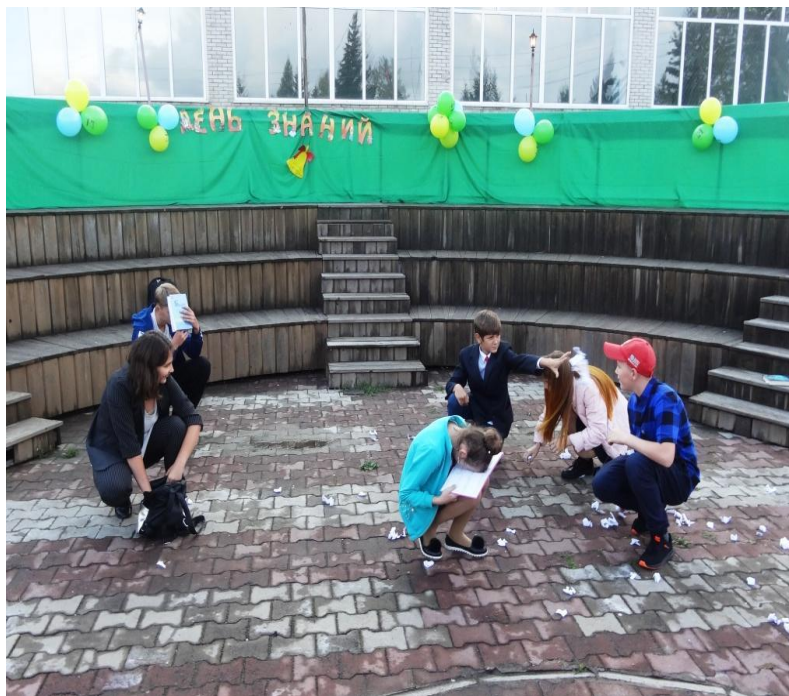
Театрализованно – игровая программа ко дню знаний