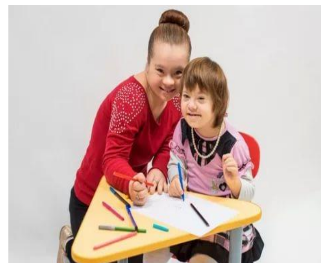
Дети с ОВЗ