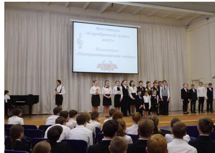
Номинация «Патриотическая песня» 8-5