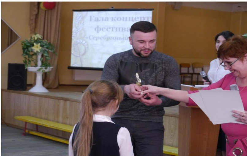
Вручение диплома Победителей

городская научно-практическая конференция НОВЫЕ ПУТИ РАЗВИТИЯ ДОПОЛНИТЕЛЬНОГО ОБРАЗОВАНИЯ