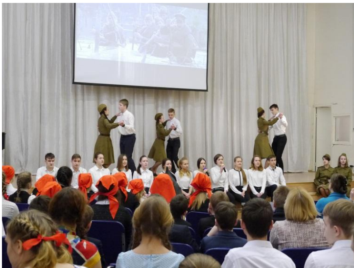
Номинация «Патриотическая песня» 11-2

городская научно-практическая конференция НОВЫЕ ПУТИ РАЗВИТИЯ ДОПОЛНИТЕЛЬНОГО ОБРАЗОВАНИЯ