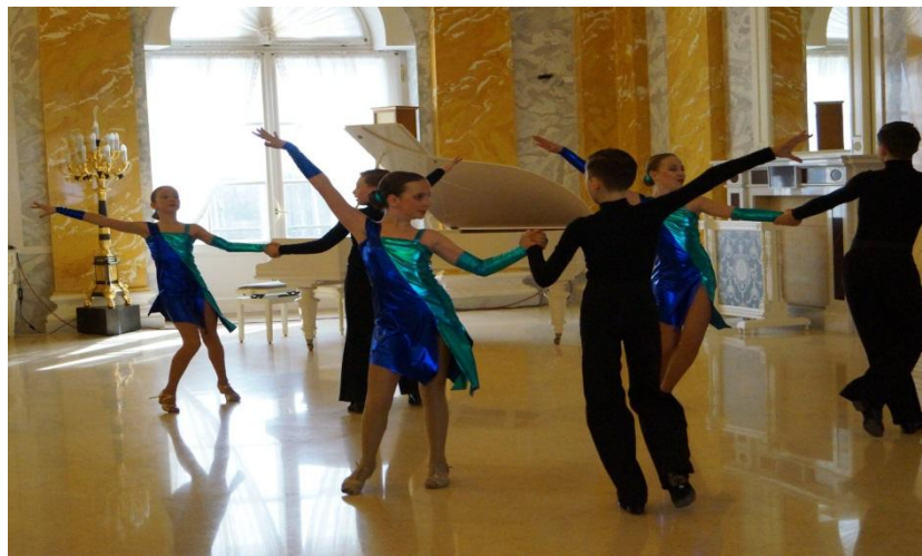
Выступление Танцевального коллектива

городская научно-практическая конференция НОВЫЕ ПУТИ РАЗВИТИЯ ДОПОЛНИТЕЛЬНОГО ОБРАЗОВАНИЯ