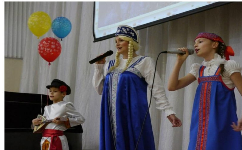
Фрагмент выступления семейного вокального ансамбля