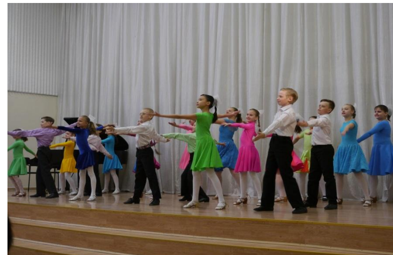
Номинация «Танце вальное творчество»