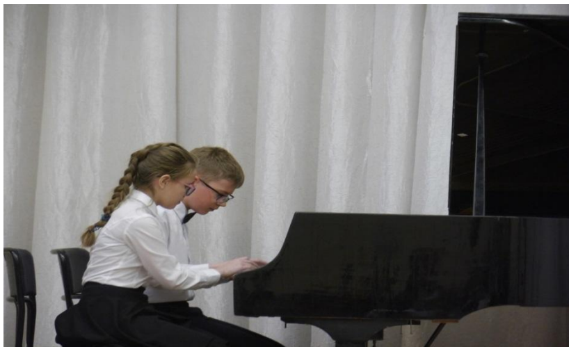
Номинация «Ансамблевое музицирование»

городская научно-практическая конференция НОВЫЕ ПУТИ РАЗВИТИЯ ДОПОЛНИТЕЛЬНОГО ОБРАЗОВАНИЯ