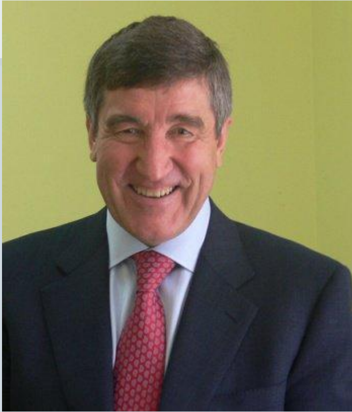
Юрий Константинович Шафраник

Министр топлива и энергетики России, губернатор Тюменской области, выпускник Тюменского индустриального института.