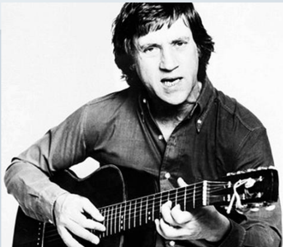
Владимир Семенович Высоцкий

Исполнитель песни об открытии тюменской нефти? И ожила земля, и помню ночью я На той земле танцующих людей... Я счастлив, что превысив полномочия, Мы взяли риск - и вскрыли вены ей!