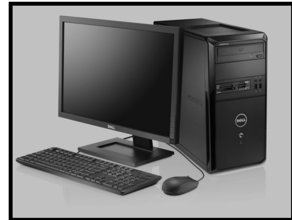
Computer mit Internet