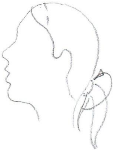
Прядь у лица Хвост