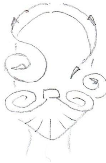
Валик Пряди от лица