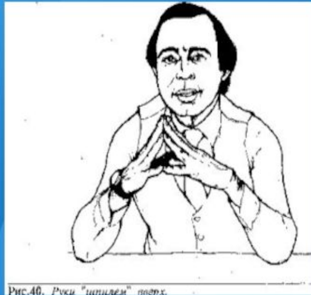
Рис.40. Руки "шпалеи" вверх.

Шпалеобразное положение рук, или «шпиль», - жест означает, что человек абсолютно уверен в себе и своих знаниях, ощущает своё превосходство над другими людьми, обладает твёрдой и непререкаемой жизненной позицией.