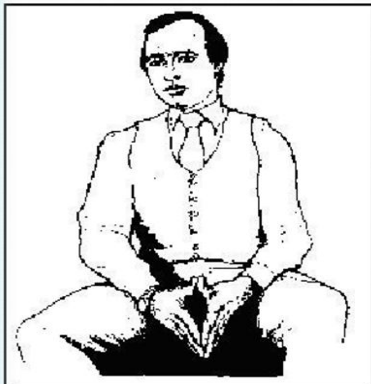
Руки "шпалем" вниз

Когда человек использует жест «шпалем» вниз, он обычно не говорит, а слушает.