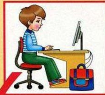
Посадка за компьютером