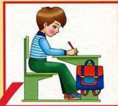
Посадка при письме