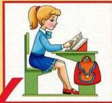
Посадка при чтении