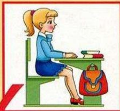
Посадка «готов к работе»