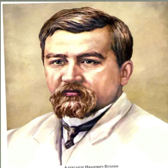
АЛЕКСАНДР ИВАНОВИЧ КУПРИН