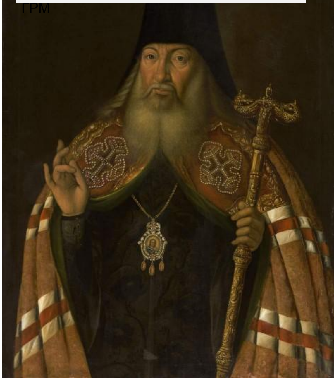
Антропов - Портрет Дубянского Ф. Я., духовника Елизаветы 1761