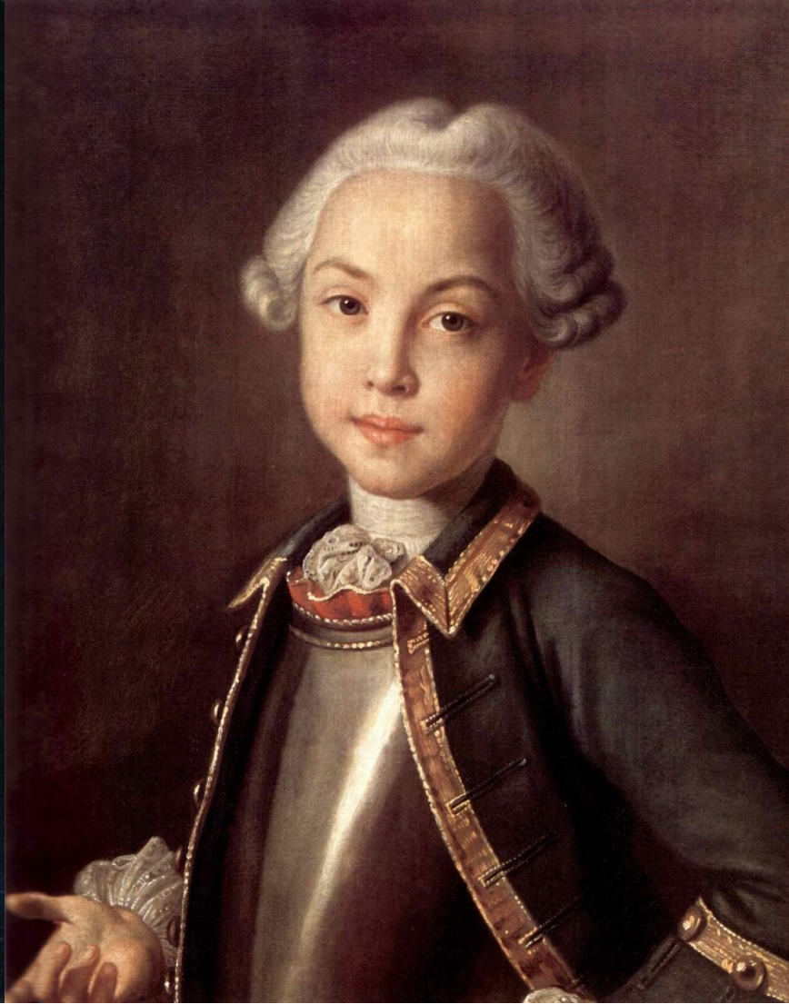
Шереметьев Николай 1750-е