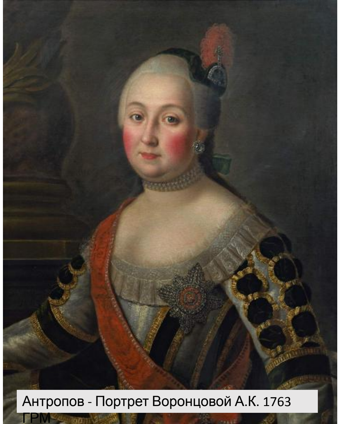
Антропов - Портрет Воронцовой А.К. 1763