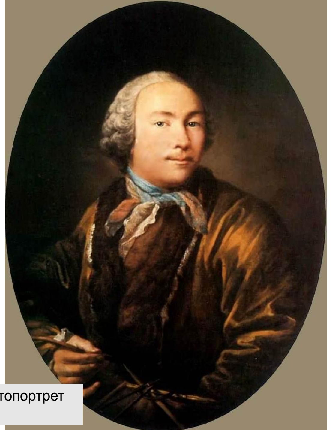
Аргунов – Автопортрет (?) 1760 ГРМ