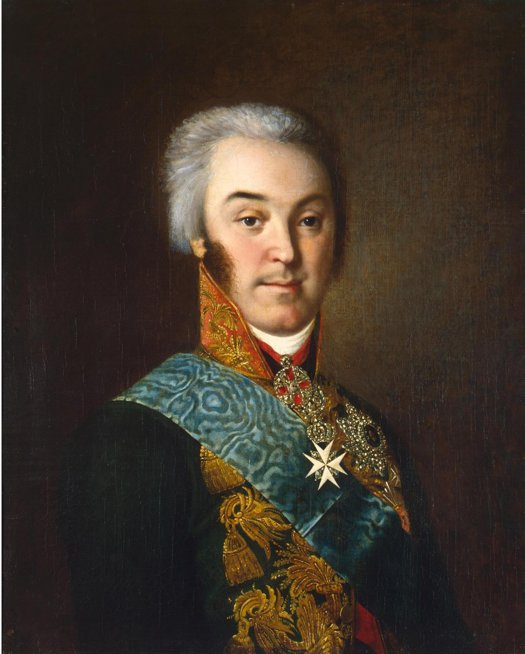
Аргунов Николай - Портрет Шереметьева Николая Петровича 1800-е Эрмитаж