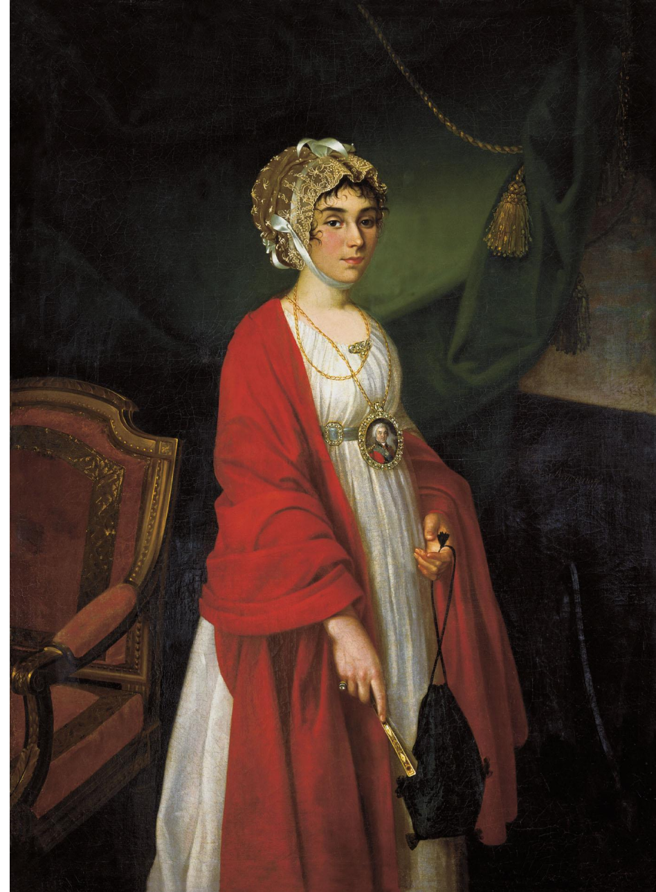
Аргунов Николай - Портрет актрисы Ковалевой- Жемчуговой Прасковьи Ивановны (Шереметьевой) 1803 Кусково