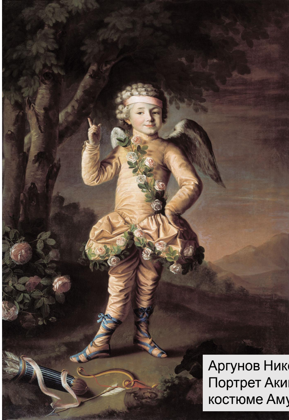
Аргунов Николай - Портрет Акимова Ивана в костюме Амура 1790 ГРМ