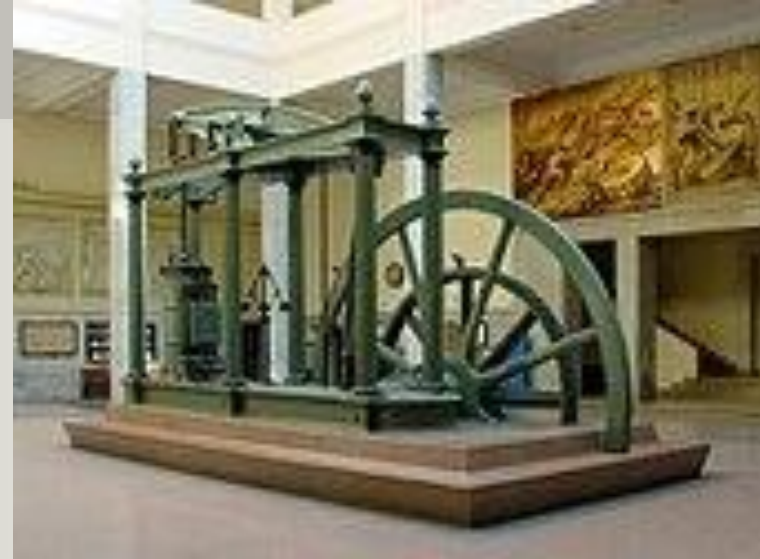
Паровая машина Джеймса Уатта