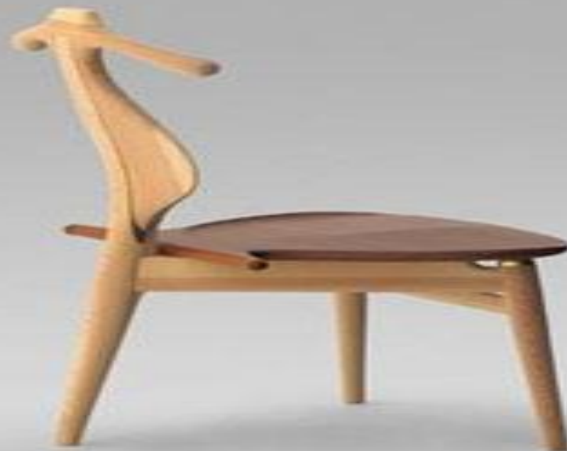
■ Стул-камердинер «Valet Chair»(1953) ■