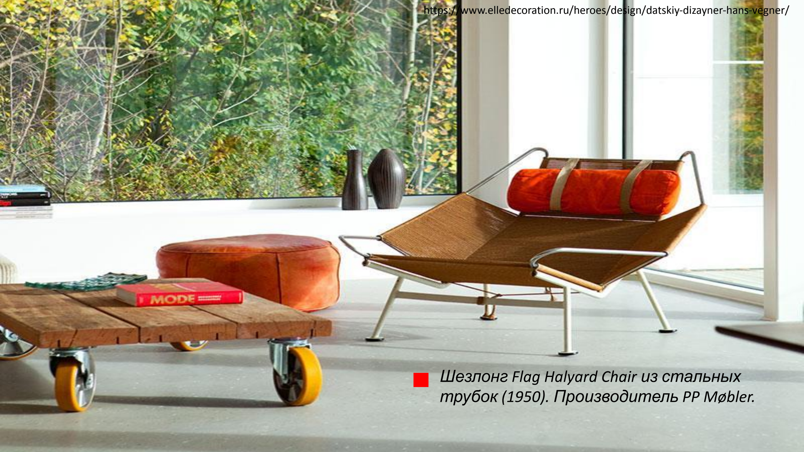
■ Шезлонг Flag Halyard Chair из стальных трубок (1950). Производитель PP Møbler.