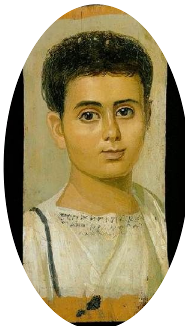
Фаюмский портрет. Египет.