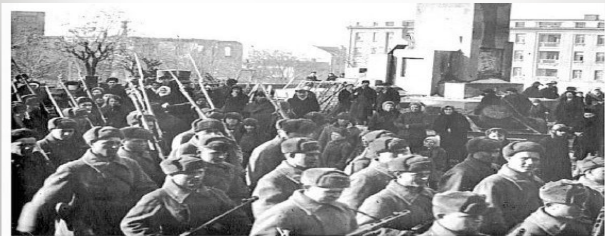
Парад советских войск в освобожденном Ворошиловграде. 1943 г.

Стоит отметить, что активную помощь войскам регулярной армии оказывали и луганские отряды сопротивления.