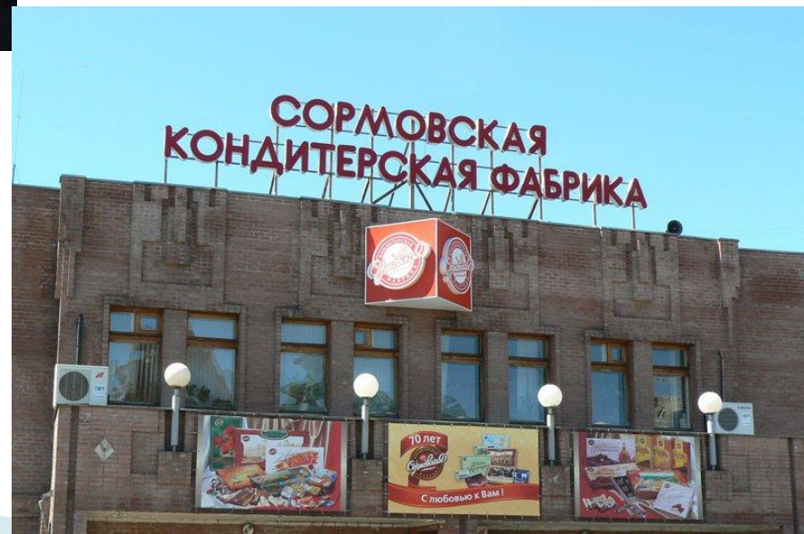
Сормовская кондитерская фабрика