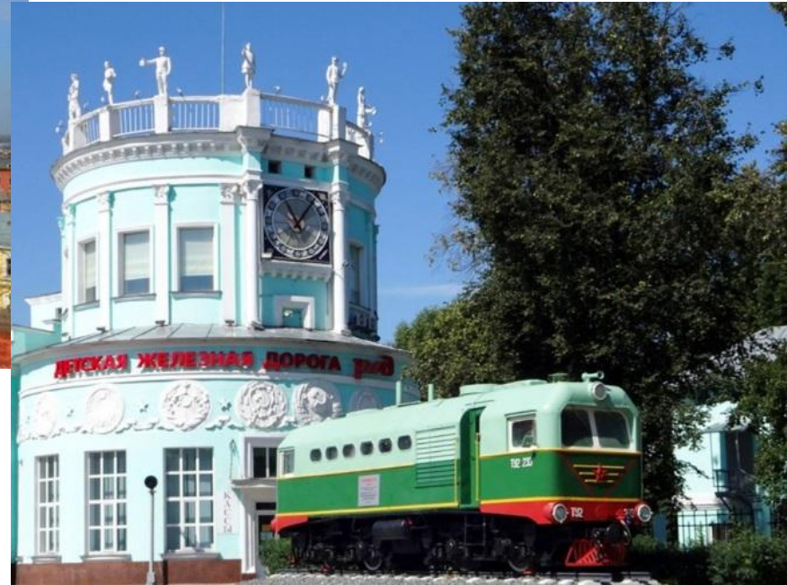
Детская железная дорога