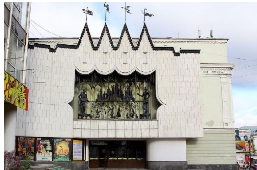
Нижегородский театр кукол