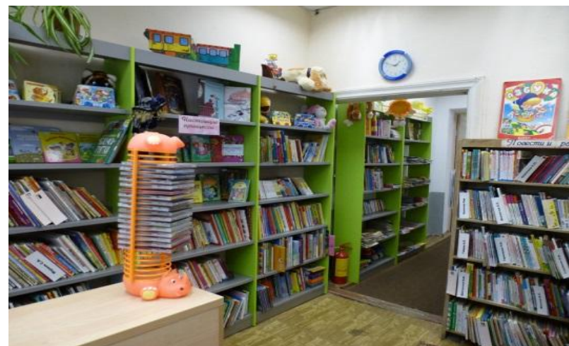
Библиотека им. Андрианова