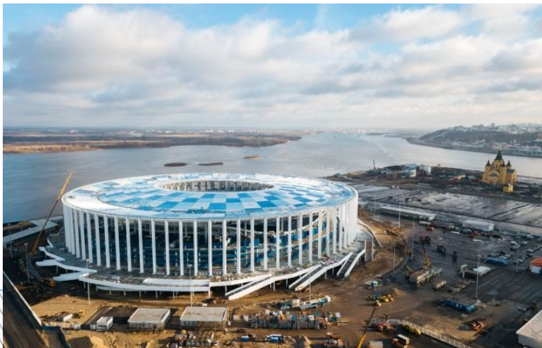
Стадион «Нижний Новгород»