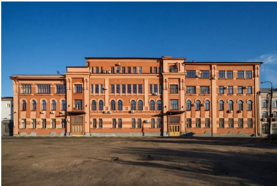
Завод «Красное Сормово»

Нижний Новгород – не только культурный, исторический, но и промышленный центр.