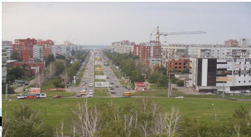
Ул. 40 лет Победы