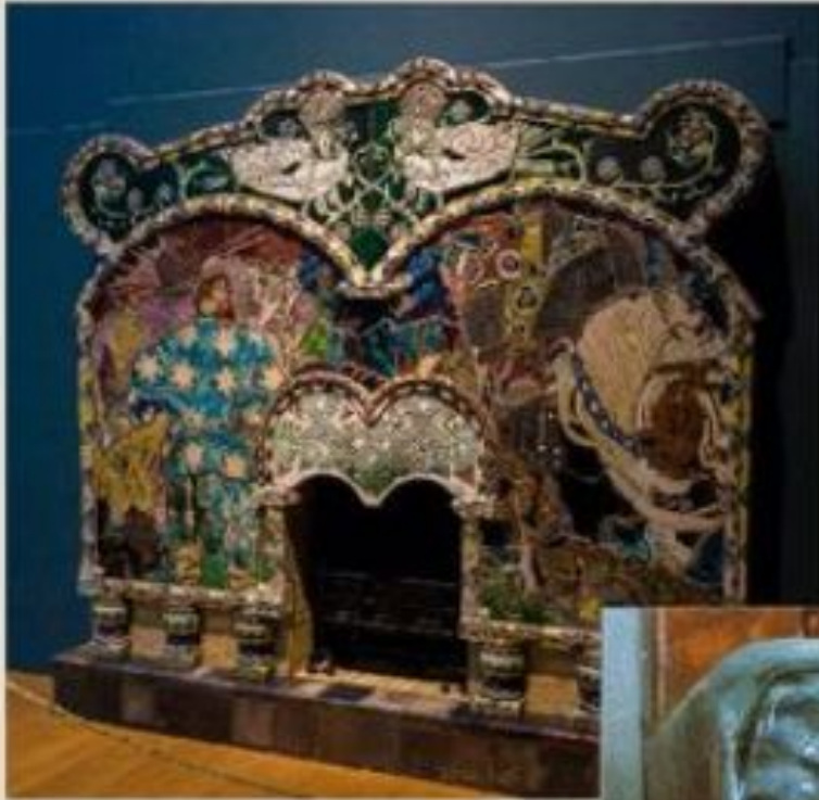
Камин «Микула Селянинович и Вольга»