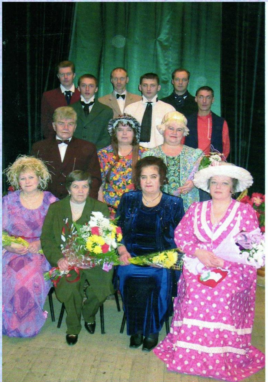
«Без вины виноватые» , А.Н.Островский, 2006 год