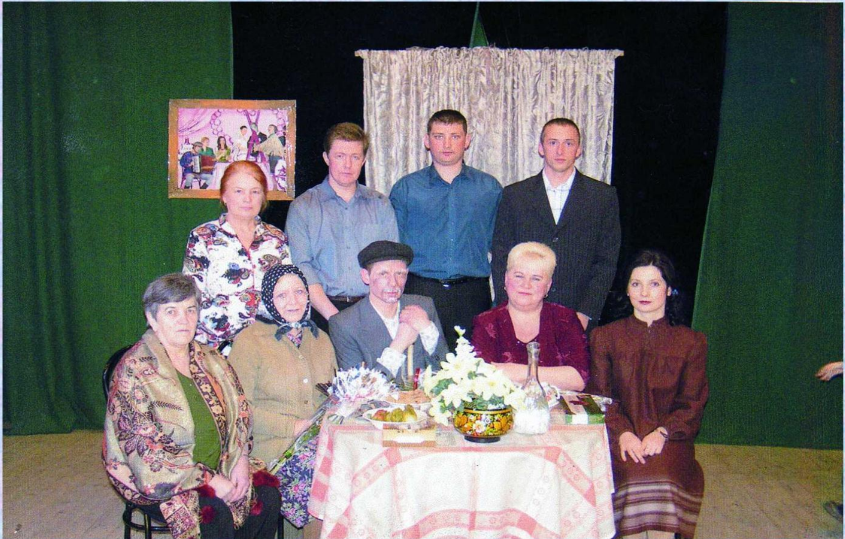
«По соседству мы живем», режиссер А.А.Суховская, 2009 год