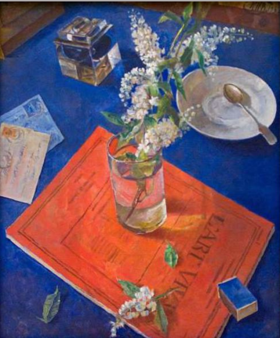
«Черёмуха в стакане», 1932, ГРМ