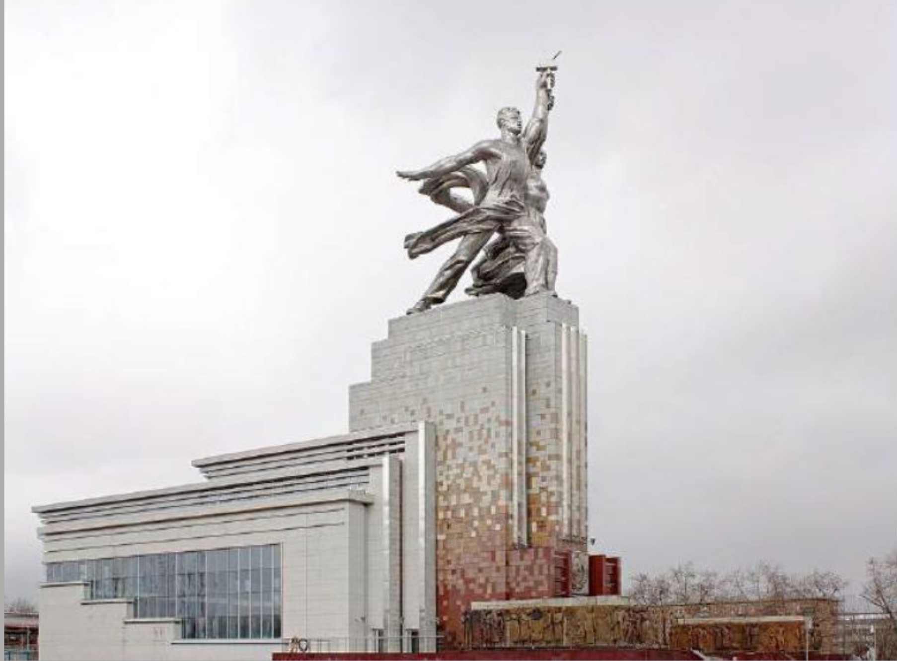
Монумент «Рабочий и колхозница» . Москва