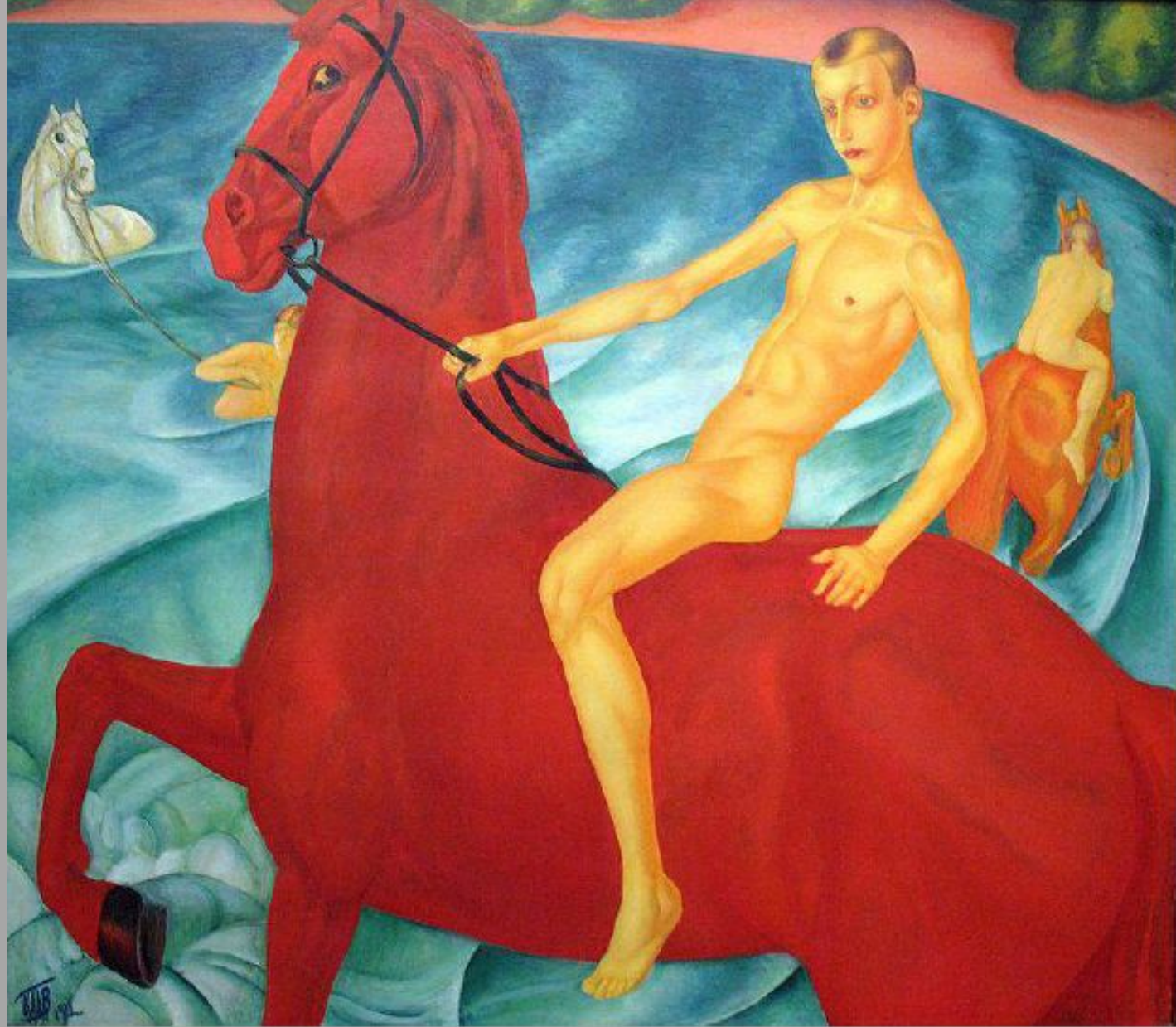
Купание красного коня. 1912. Третьяковская галерея