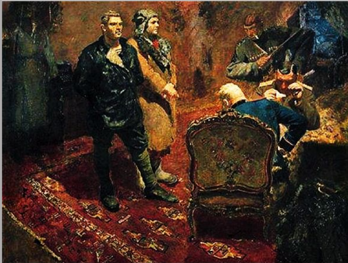
«Допрос коммунистов» 1933 г. ГТГ

Русский и советский художник и педагог, один из ведущих представителей социалистического реализма в живописи, профессор.