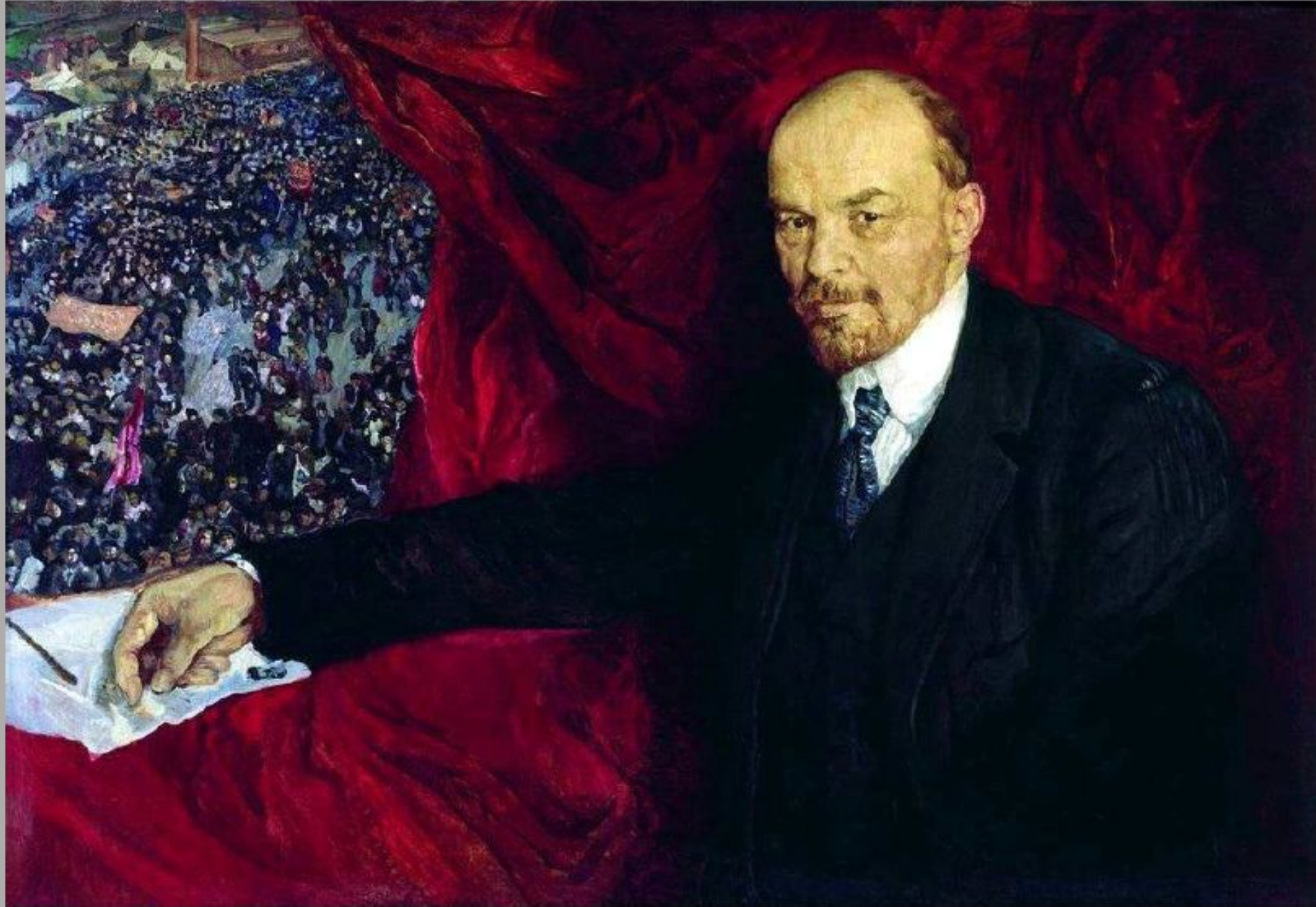
Ленин и манифестация