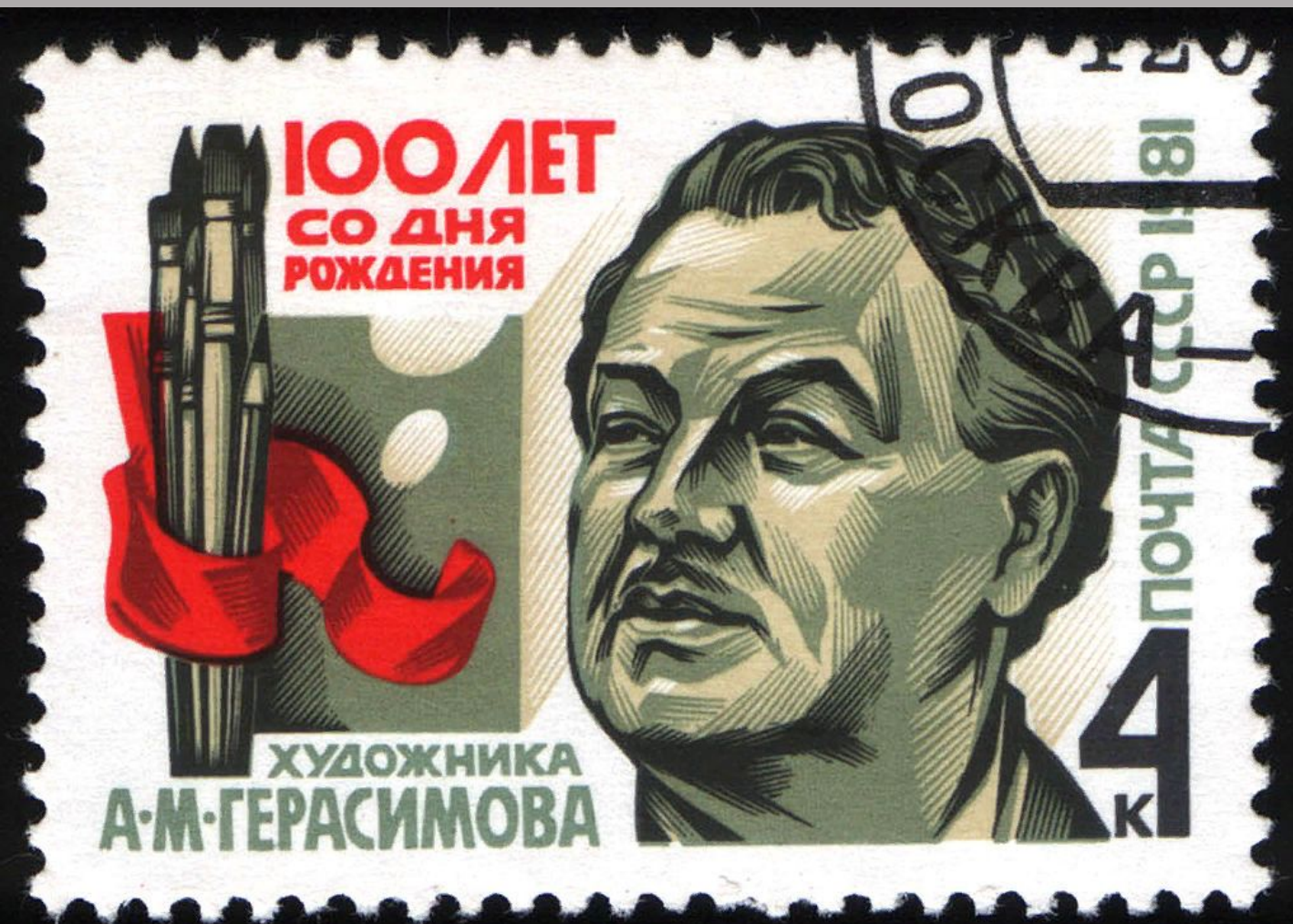
Марка СССР 1971 года

Александр Михайлович Герасимов (31 июля [12 августа] 1881, Козлов, Тамбовская губерния, Российская империя — 23 июля 1963, Москва, СССР) — российский, советский художник-живописец, архитектор, скульптор[6], теоретик искусства, педагог, профессор. Первый президент Академии художеств СССР в 1947—1957 годах. Академик АХ СССР (1947). Народный художник СССР (1943). Лауреат четырёх Сталинских премий (1941, 1943, 1946, 1949).