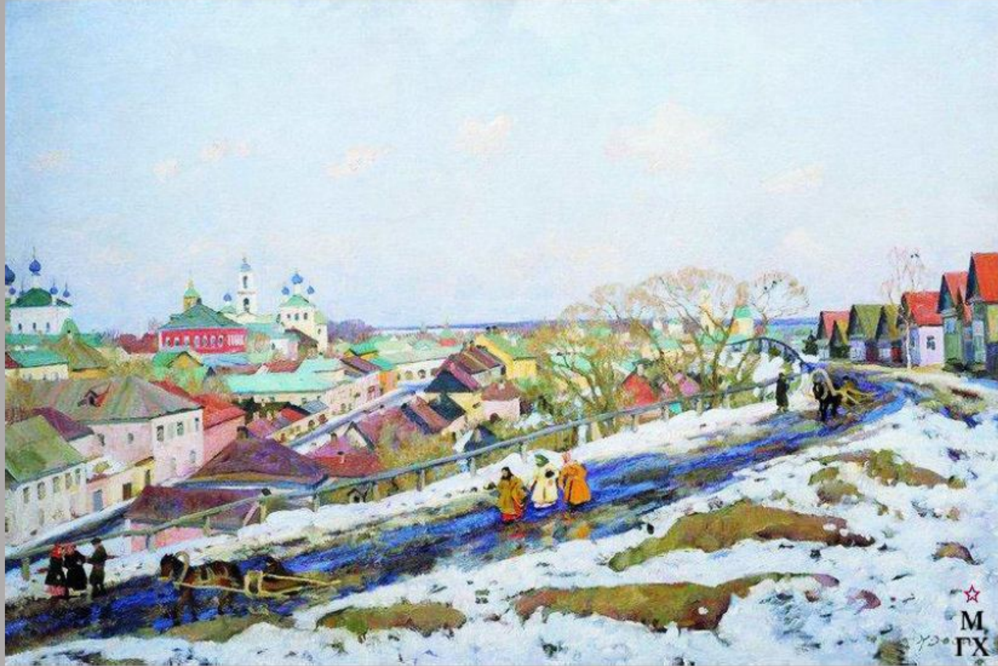
В провинции. Город Торжок. Тверская губерния.