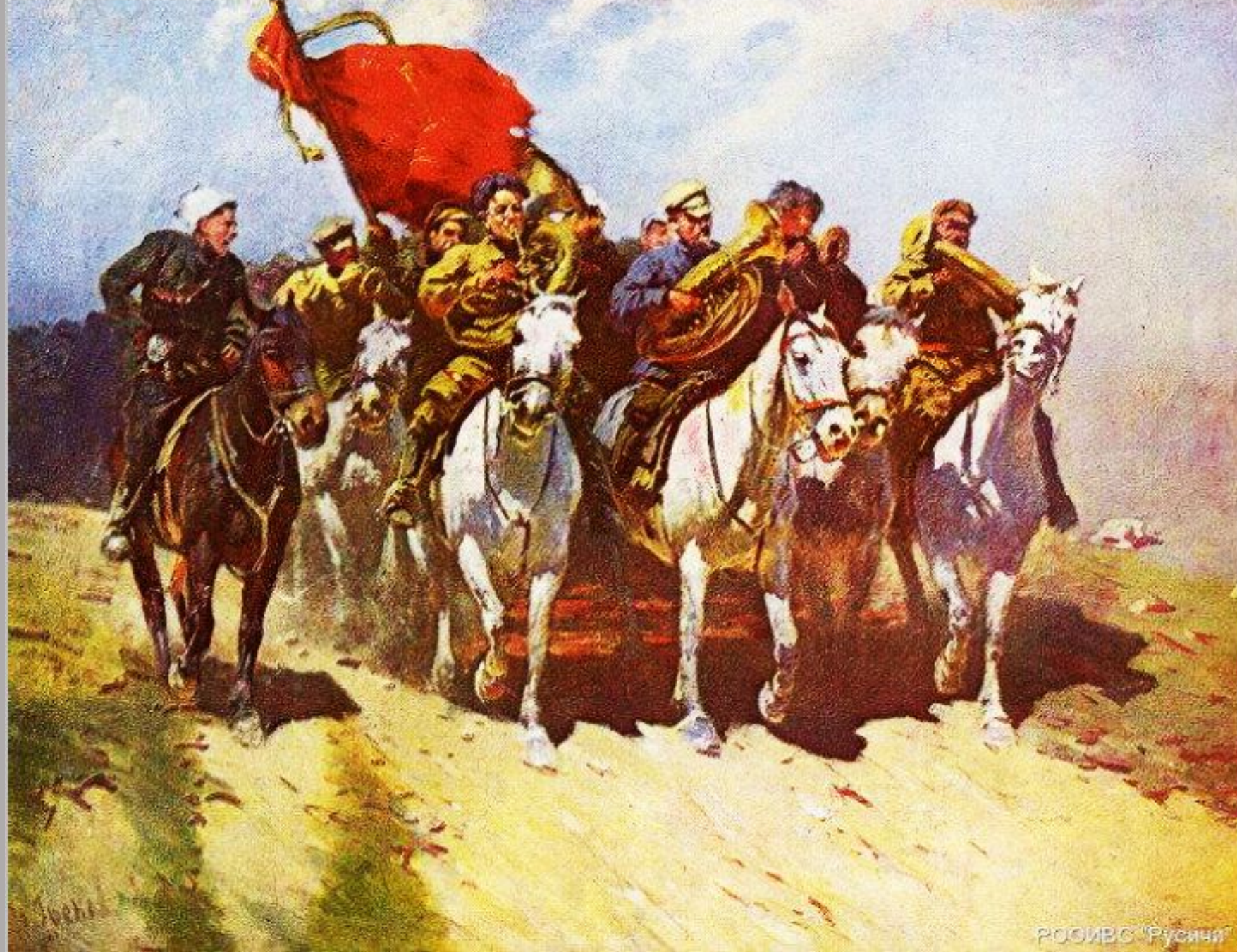
«Первая конная армия», Москва, Г Т, 1935 г.