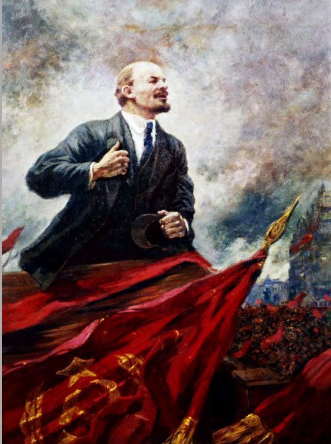
«Ленин на трибуне», Москва !929-1930