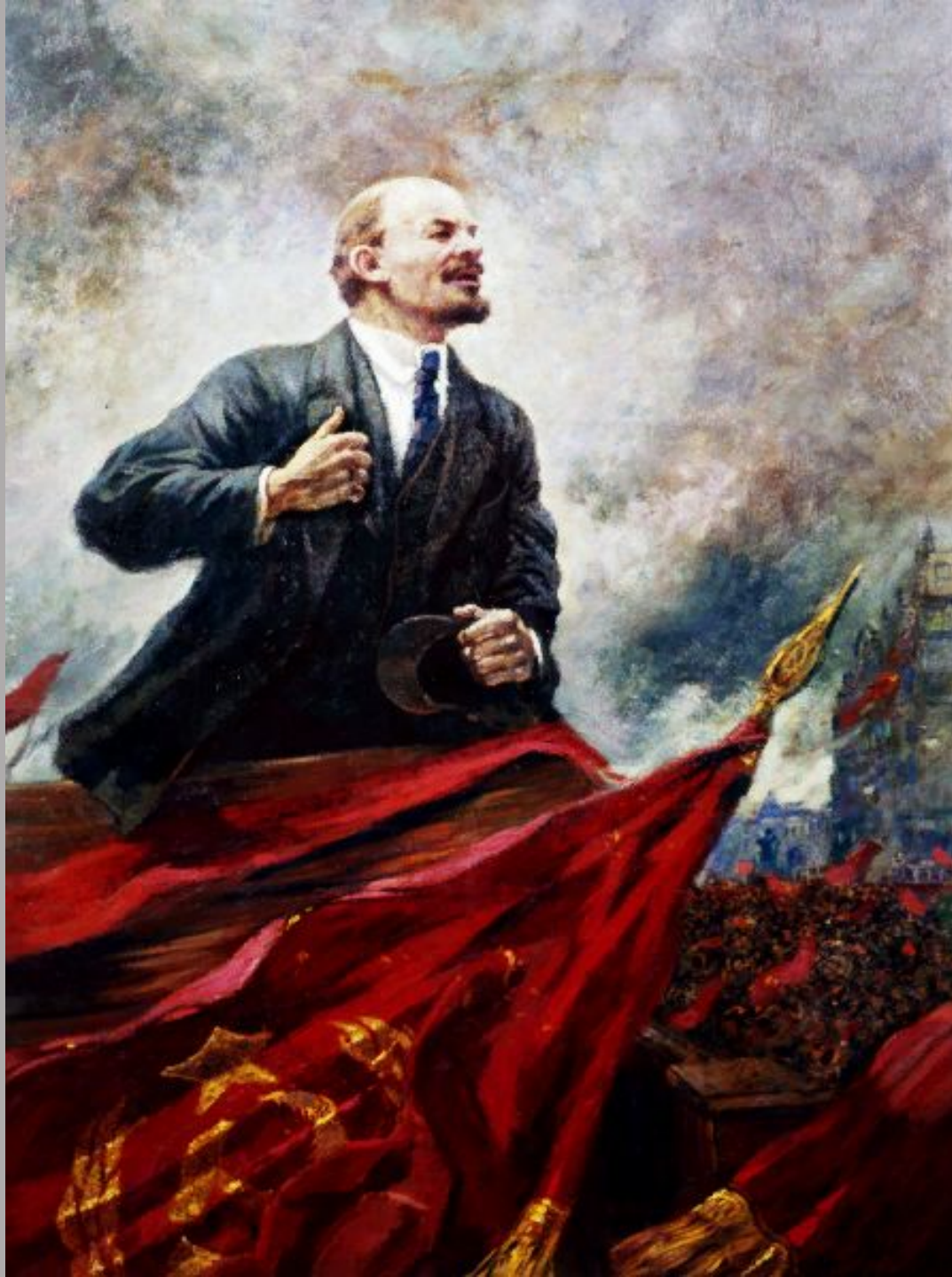
«Ленин на трибуне», Москва 1929-1930