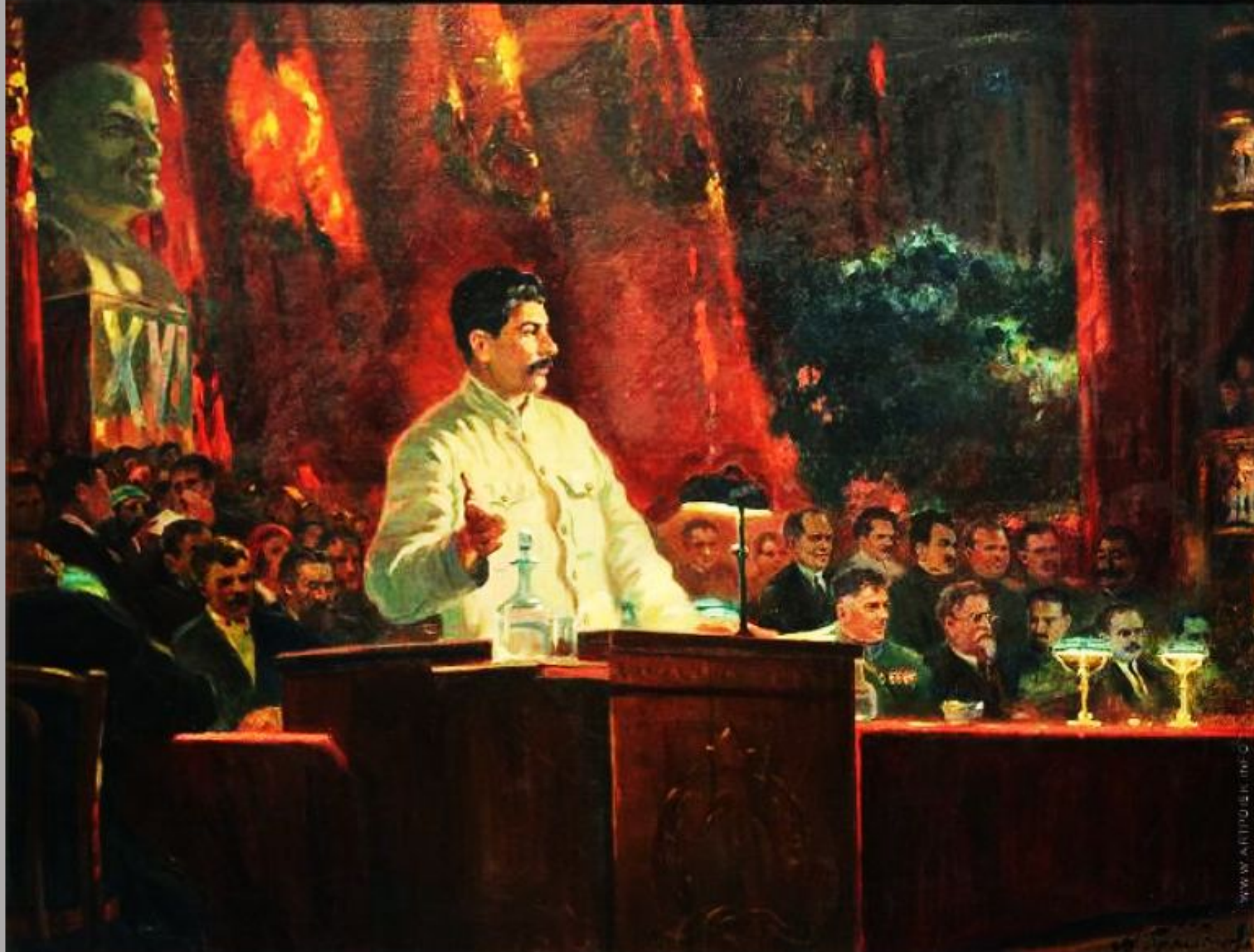
«Доклад тов. Сталина на XVI партсъезде» 1931