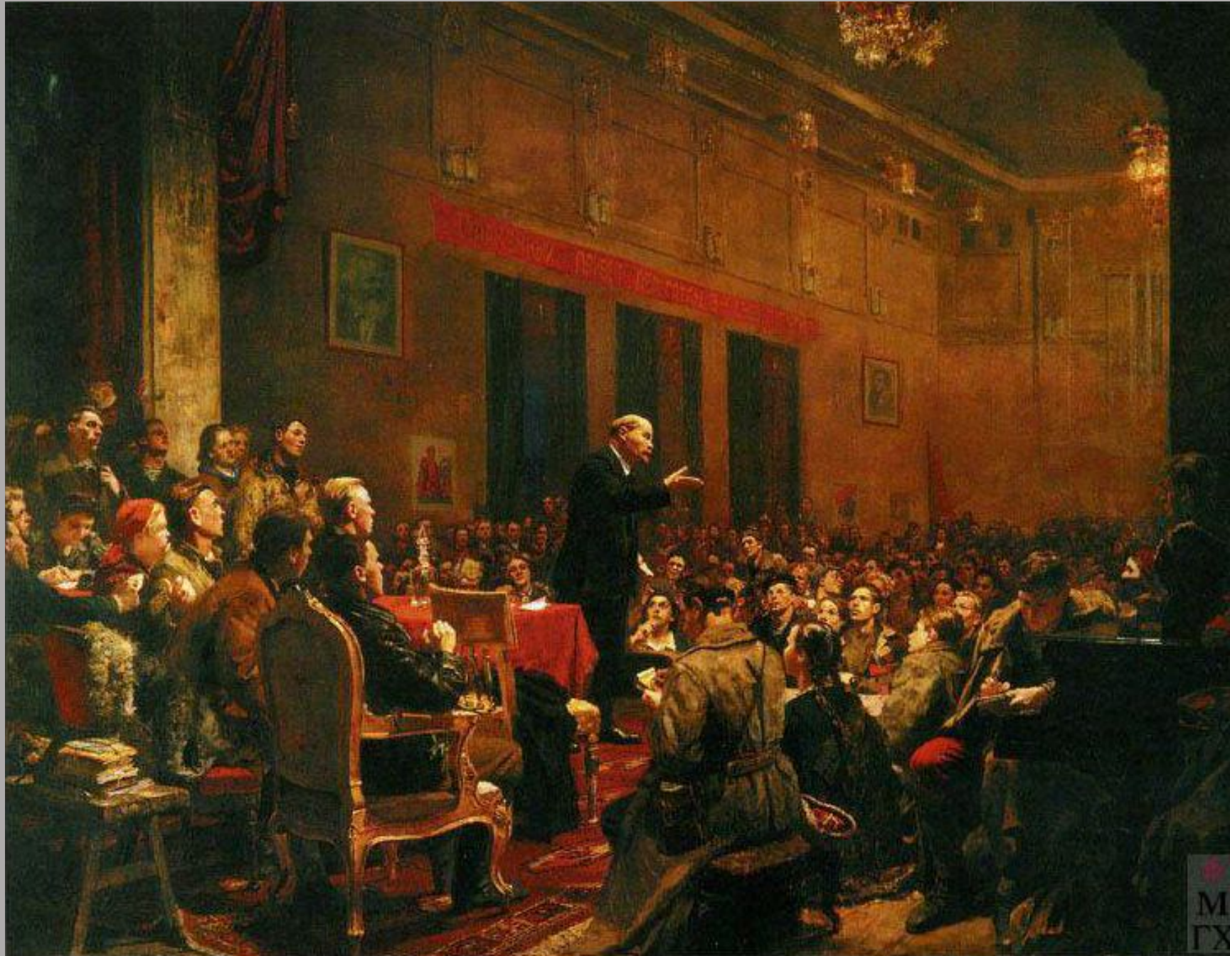
«Выступление В. И. Ленина на III съезде комсомола» (1950)