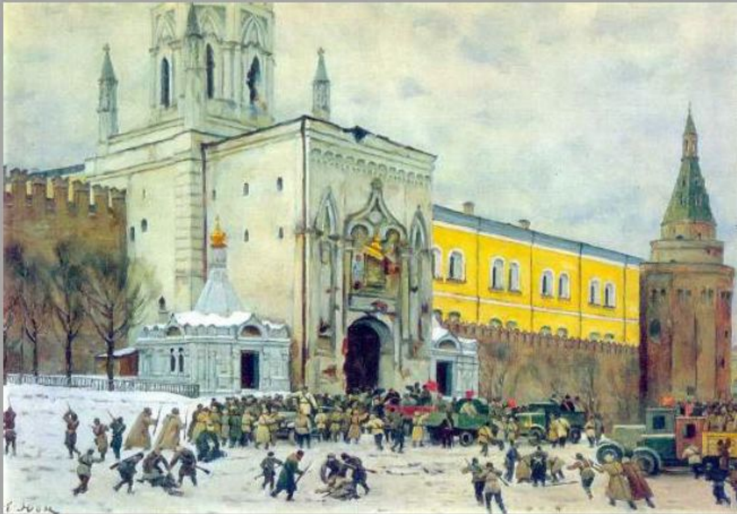
«Штурм Кремля в 1917 году»

Русский и советский живописец, мастер пейзажа , театральный художник, теоретик искусства.