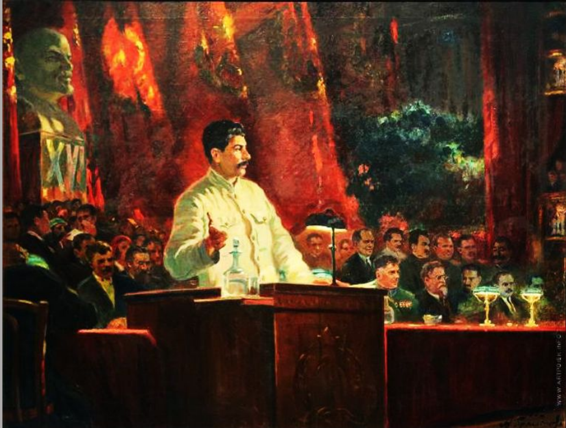
«Доклад тов. Сталина на XVI партсъезде» 1931