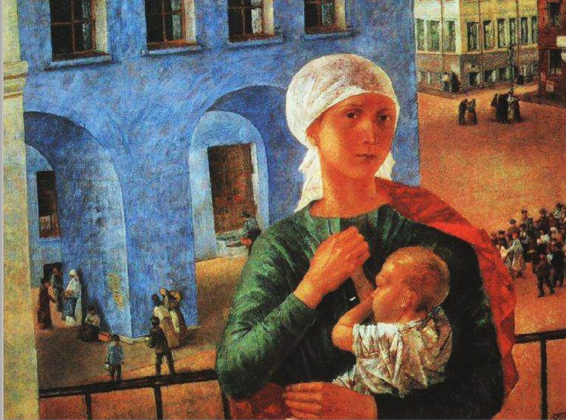
«1918 год в Петрограде» («Петроградская мадонна»), 1920, ГТГ