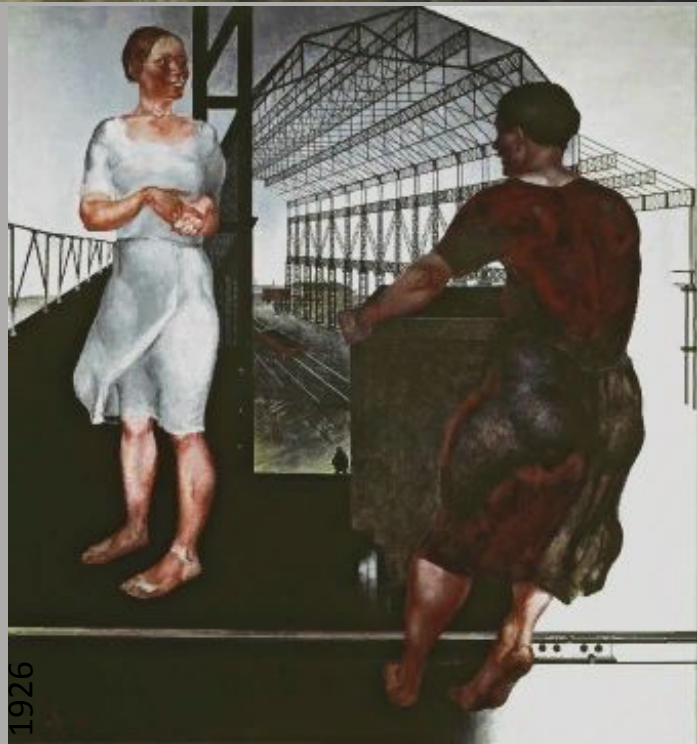
А. Дейнека. «На стройке новых цехов»,

Основной своей задачей ОСТовцы, как и «АХРРовцы», считали борьбу за возрождение и дальнейшее развитие станковой картины на современную тему или с современным содержанием.