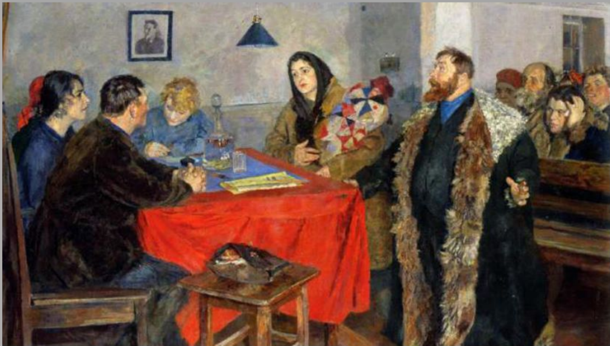
«Советский суд», UNU (1928)