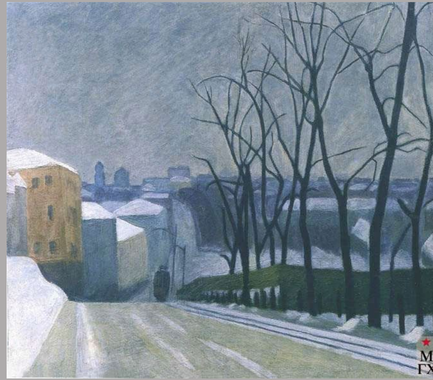
Бушинский С. Н. «Рождественский бульвар», 1928