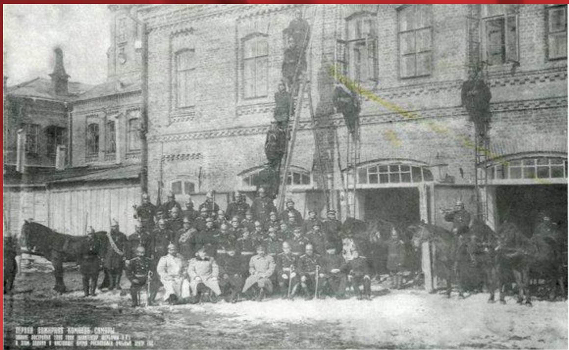
Первое пожарное депо в России построено в 1851 году в г. Торжок Тверской губернии