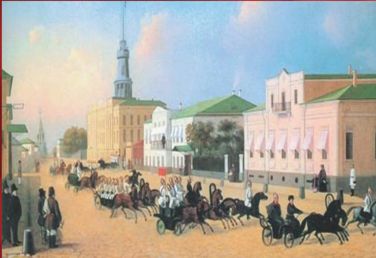
Выезд Пречистенской пожарной команды города Москвы. 1840-е годы

Царским указом 1804 года была создана штатная пожарная команда и в Москве.