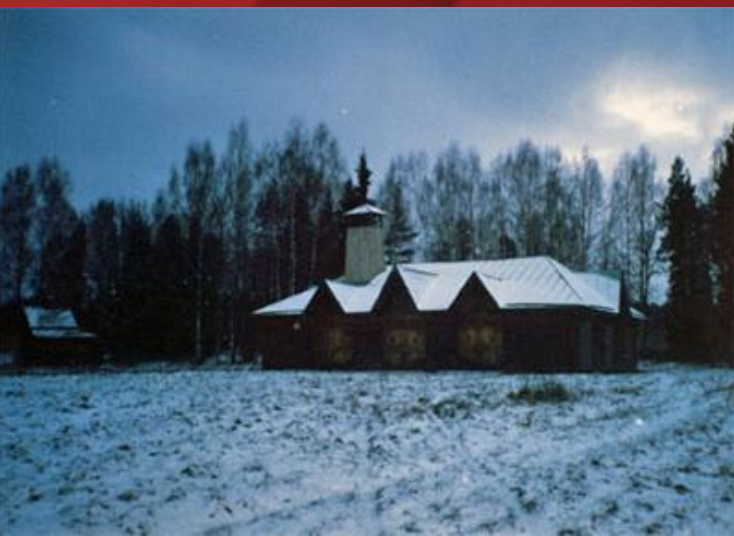
Пожарное депо в г.Торжок Тверской обл.

При царе Николае I началась планомерная организация пожарных команд в Российской империи и повсеместное строительство пожарных депо для размещения пожарных команд.