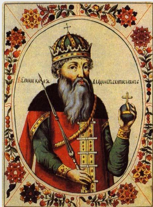
Владимир Красное Солнышко