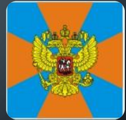
ВОЙСКА ГРАЖДАНСКОЙ ОБОРОНЫ