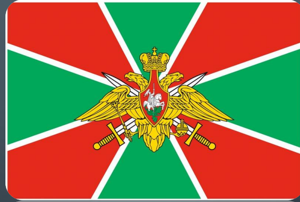
ПОГРАНИЧНЫЕ ВОЙСКА РФ