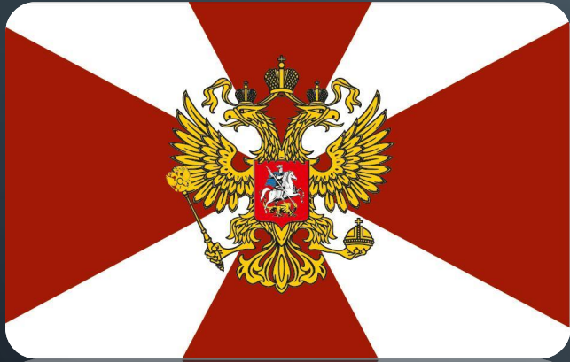
Войска национальной гвардии Российской Федерации;

К ВОЙСКАМ, НЕ ВХОДЯЩИМ В ВИДЫ И РОДА ВОЙСК ВООРУЖЕННЫХ СИЛ, ОТНОСЯТСЯ ПОГРАНИЧНЫЕ ВОЙСКА, ВОЙСКА НАЦИОНАЛЬНОЙ ГВАРДИИ РОССИИ, ВОЙСКА ГРАЖДАНСКОЙ ОБОРОНЫ.