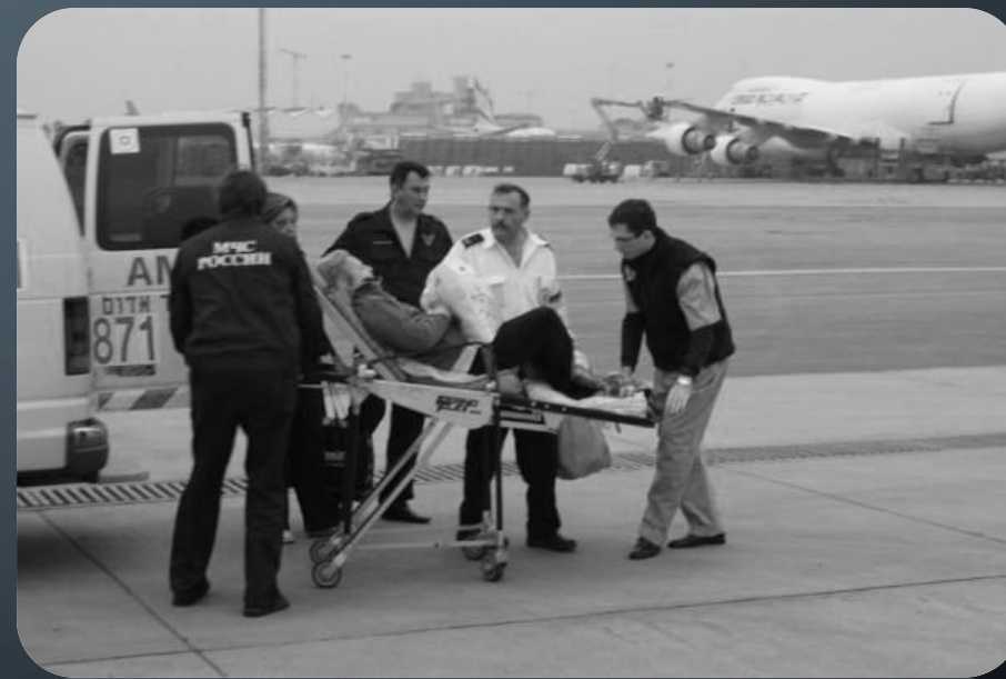
"Экстренная помощь пострадавшим при ЧС и ДТП"