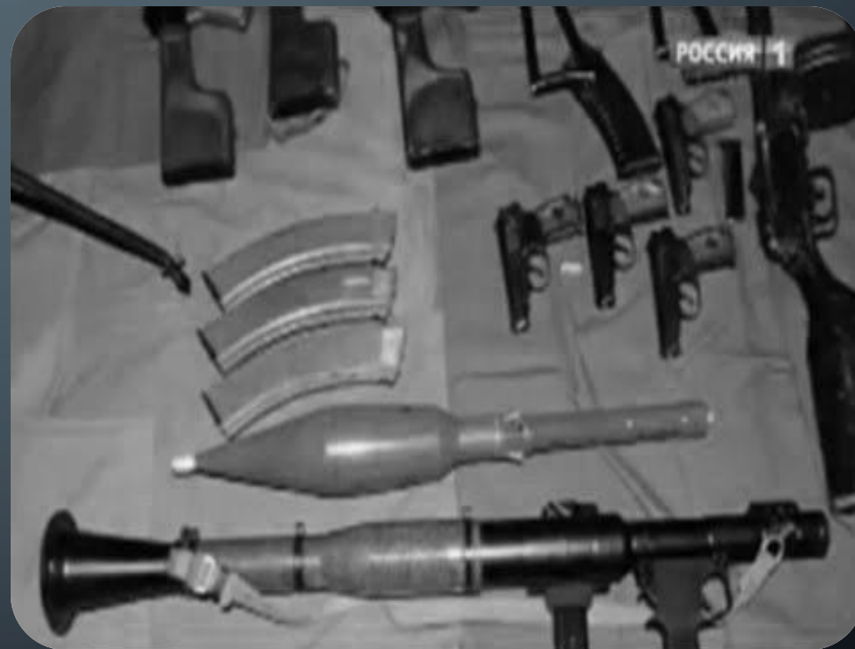
Арсенал огнестрельного оружия изъят у торговца оружием