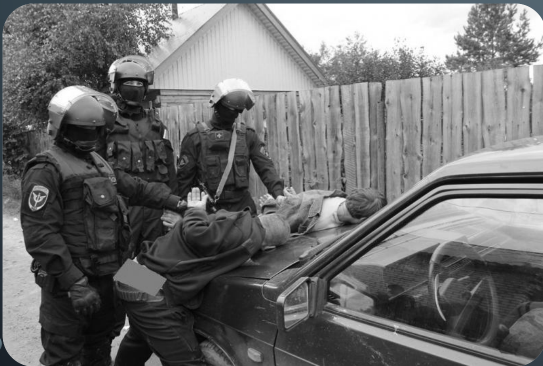
Бойцы ОМОНа задержали торговца оружием.