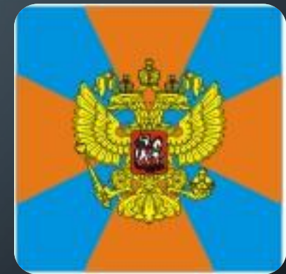
ВОЙСКА ГРАЖДАНСКОЙ ОБОРОНЫ