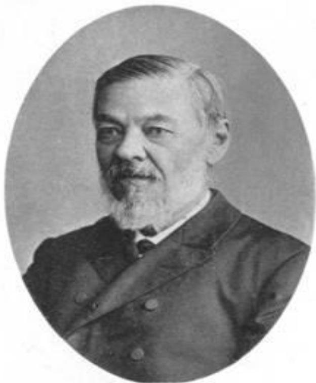
И. М. Сеченовъ.

Внутренняя речь возникает из внешней речи, формируется на ее основе. Как и внешняя речь, она рефлекторна по способу происхождения. Различие состоит в том, что эфферентная часть внутреннеречевых рефлексов заторможена. Рефлексы внутренней речи — это функционально измененные обычные речевые рефлексы. © И.М. Сеченов