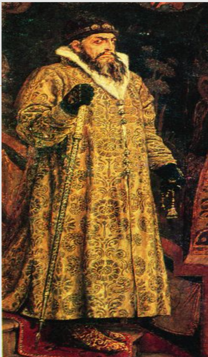
картина В.М. Васнецов