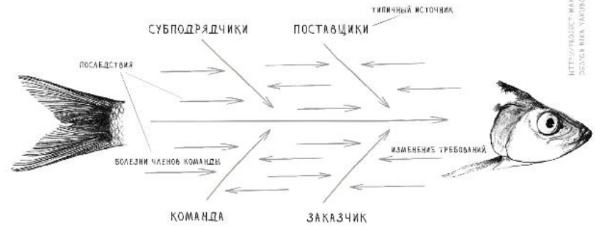
ДИАГРАММА ИСИКАВЫ («РЫБЬЯ КОСТЬ»)