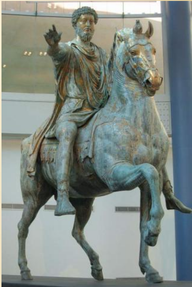
Римский император Марк Аврелий

Мастера Древнего Рима оставили много скульптурных портретов.