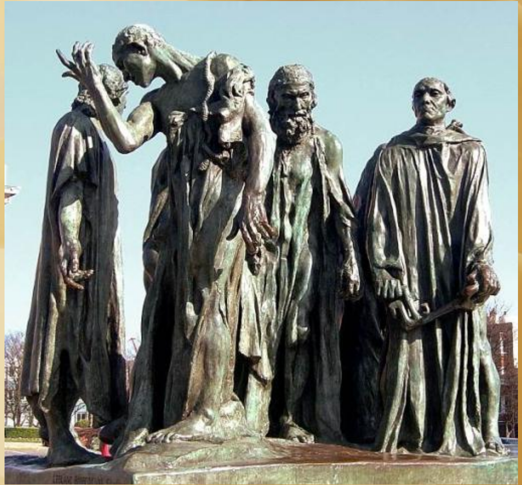
«Граждане Кале» Роден 1888 г.

Во время Столетней войны английский король Эдуард III осадил город, и спустя некоторое время голод вынудил оборонявшихся к сдаче. Король обещал пощадить жителей, только если шесть знатнейших граждан выйдут к нему в рубище и с верёвками на шее, отдавая себя на казнь. Это требование было исполнено. Английская королева Филиппа исполнилась жалостью к этим исхудавшим людям, и во имя своего нерождённого ребёнка вымолила перед супругом для них прощение.