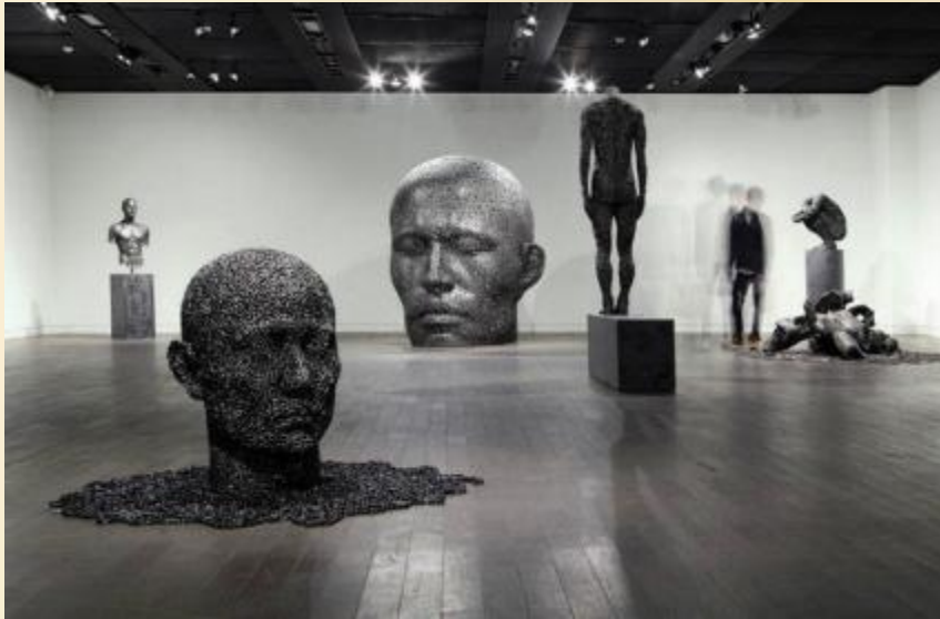
Янг-Део-Сео «Скульптуры из велосипедной цепи»