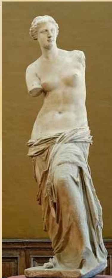
Венера Милосская II в. до н.э.