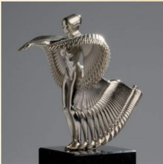
Питер Янсен «Движения человека»