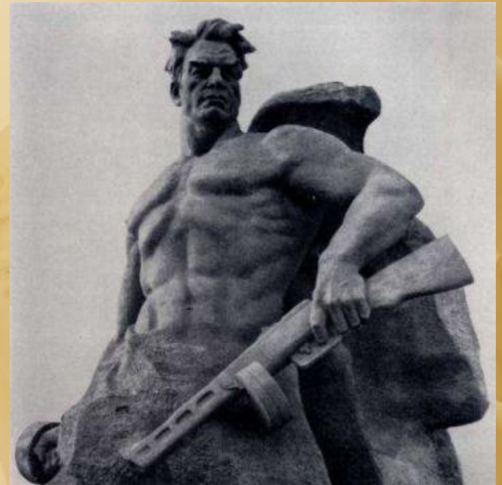
«Стоять на смерть» Е.В. Вучетич