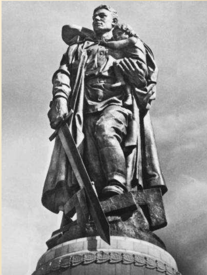
«Память советской армии» Е.В. Вучетич