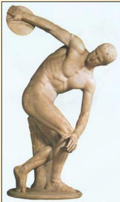
Мирон Дискобол V в. до н.э.

Античное искусство Греции показывает красоту физически совершенного человека.