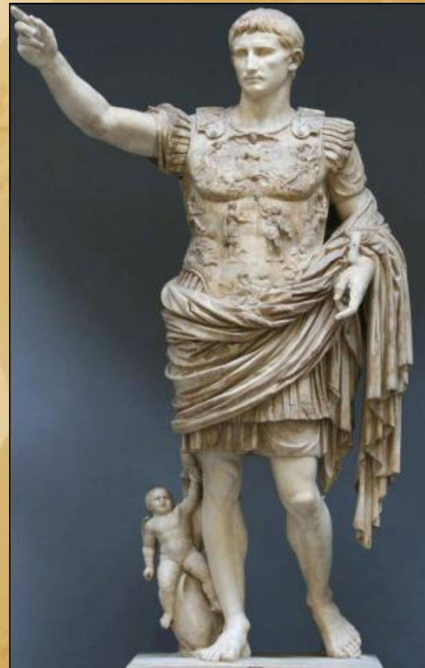
Император Август 27 г. до н.э.