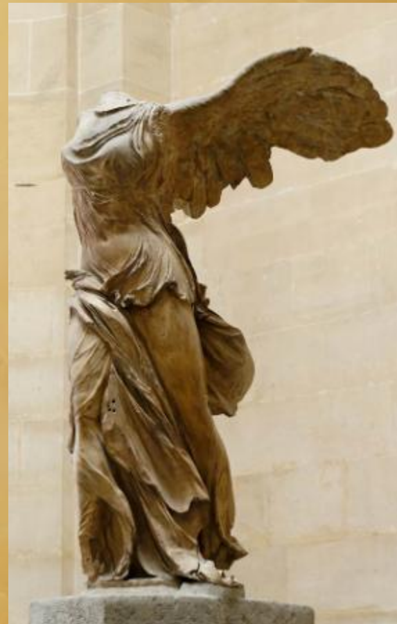
Ника Самофракийская 190 г. до н.э.