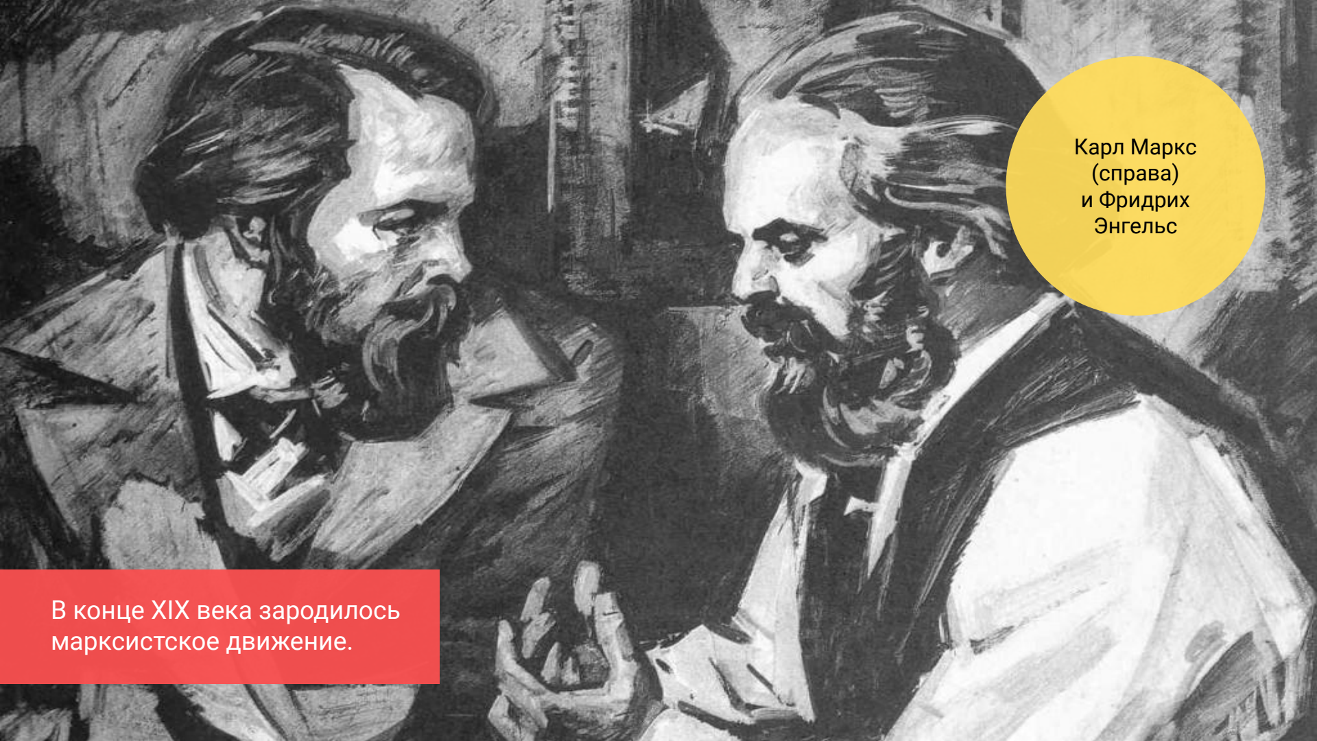
Карл Маркс (справа) и Фридрих Энгельс

В конце XIX века зародилось марксистское движение.