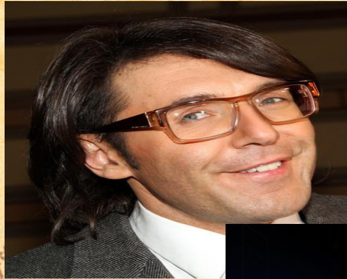
Ксения Анатольевна Собчак