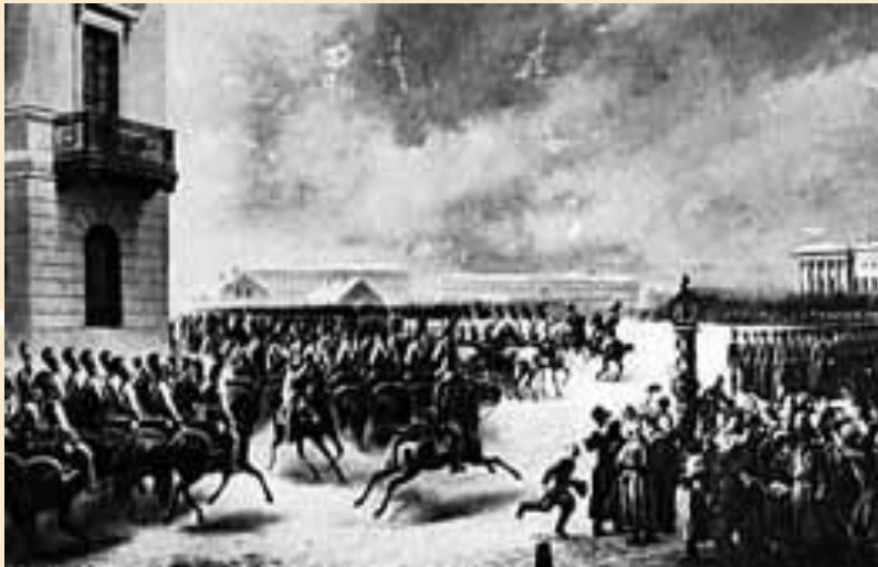
14 декабря 1825г – восстание на Сенатской площади

Первые попытки создать Конституцию в России принадлежат декабристам П. Пестелю и Н.Муравьёву. Восставшие требовали отменить крепостное право и ввести конституционное правление в России.