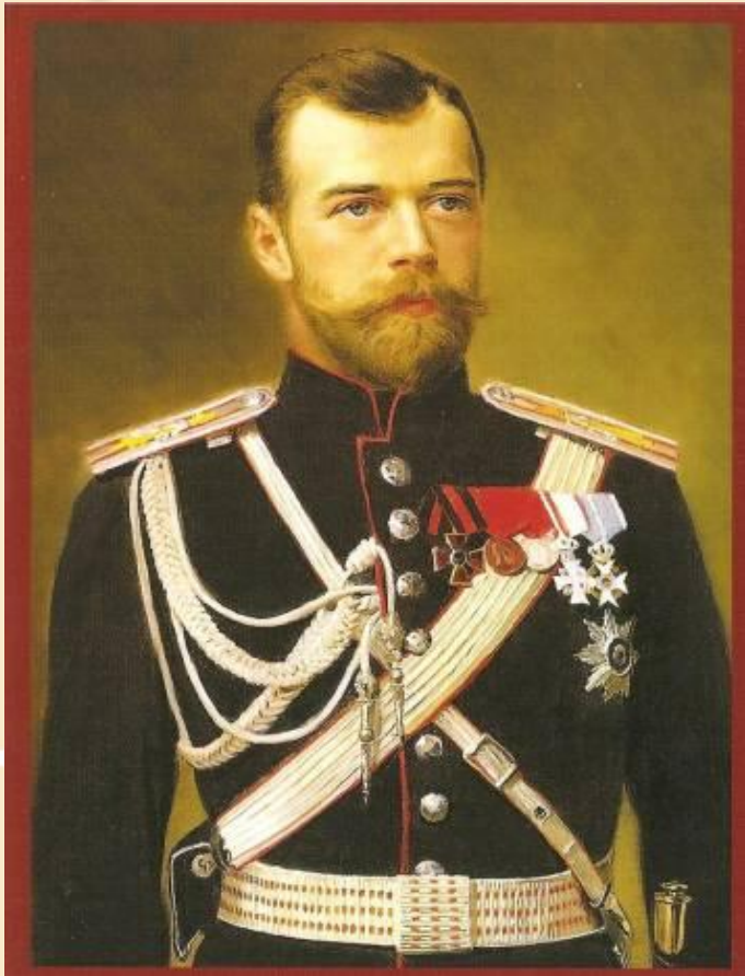
Последний русский царь Николай 2

Даровал политические и гражданские права и свободы