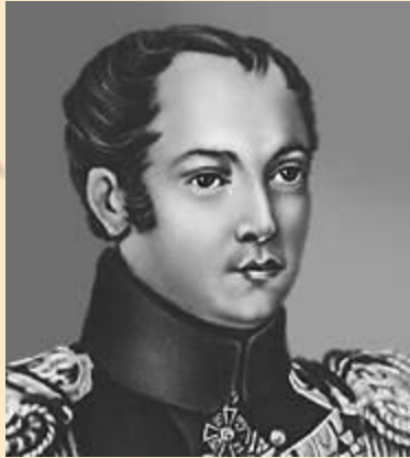
Павел Пестель, автор «Конституции» Южного общества.

Первые попытки создать Конституцию в России принадлежат декабристам П. Пестелю и Н.Муравьёву. Восставшие требовали отменить крепостное право и ввести конституционное правление в России.