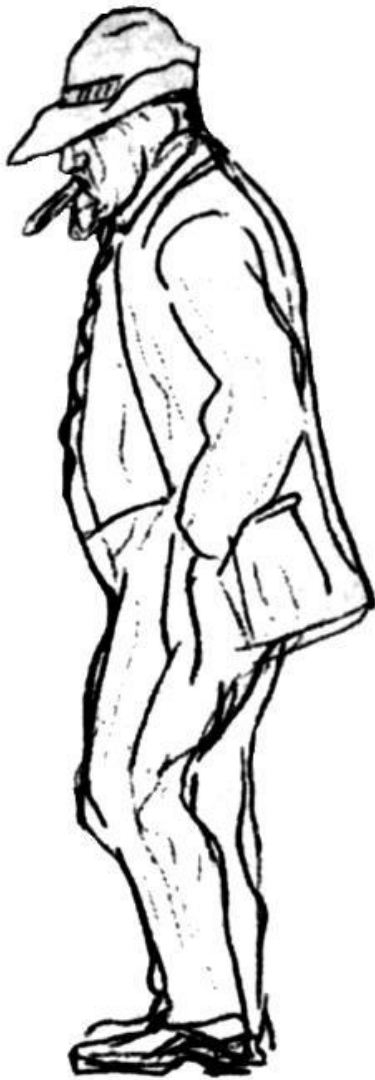
■ Скучный Серов