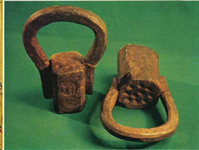
Гири 17 в.