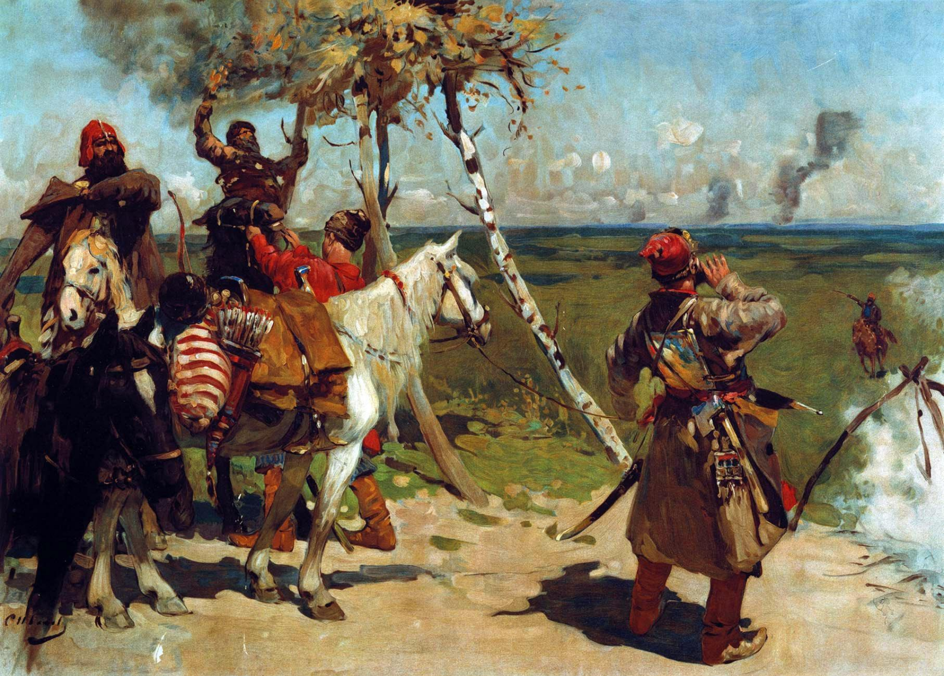
На сторожевой границе Московского государства. Худ.